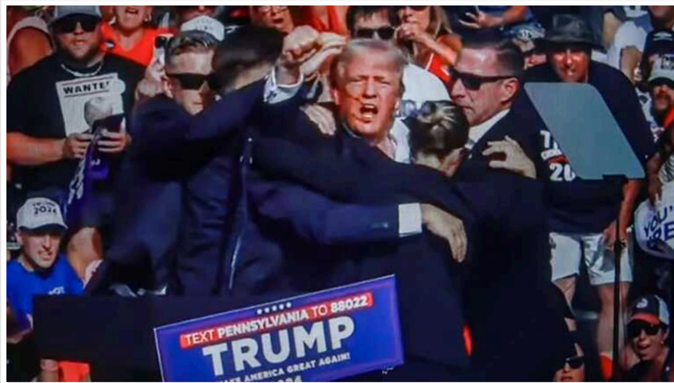
Прихильник Трампа звернув увагу на дивні моменти під час замаху на експрезидента

Блогер і прихильник Трампа Amuse розповів про дива в замаху.