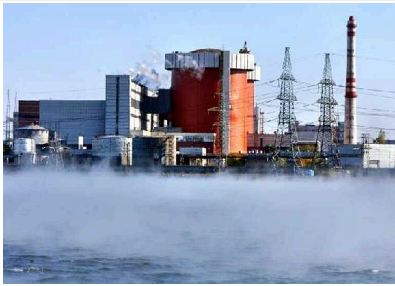
В Україні на атомних станціях за 3 дні сталося три аварії