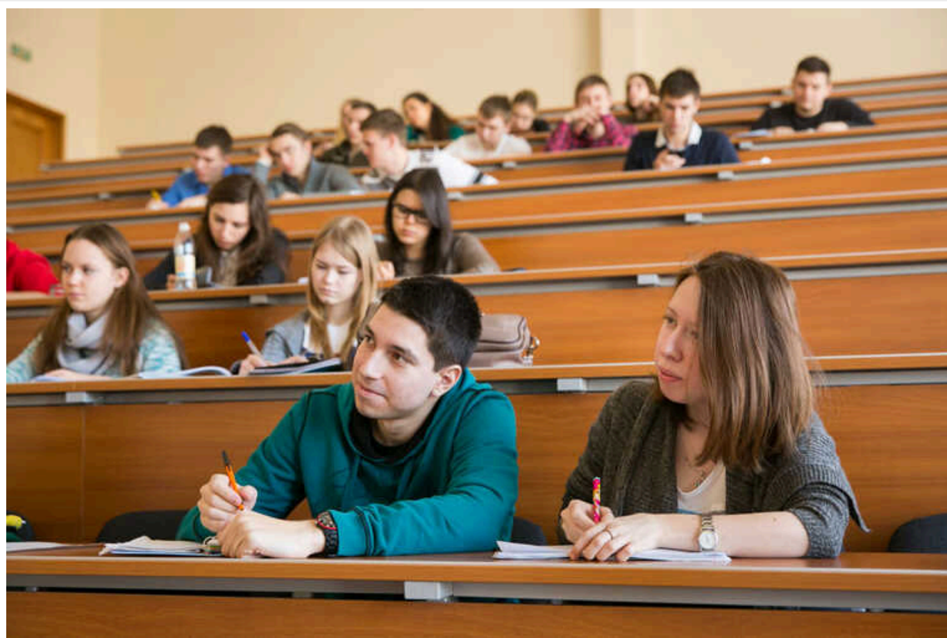
Студенти отримуватимуть гранти на навчання через "Дію"

Цього року вступники вперше зможуть отримати державний грант для оплати контракту в університеті – від 15 тисяч гривень і більше щорічно впродовж навчання.