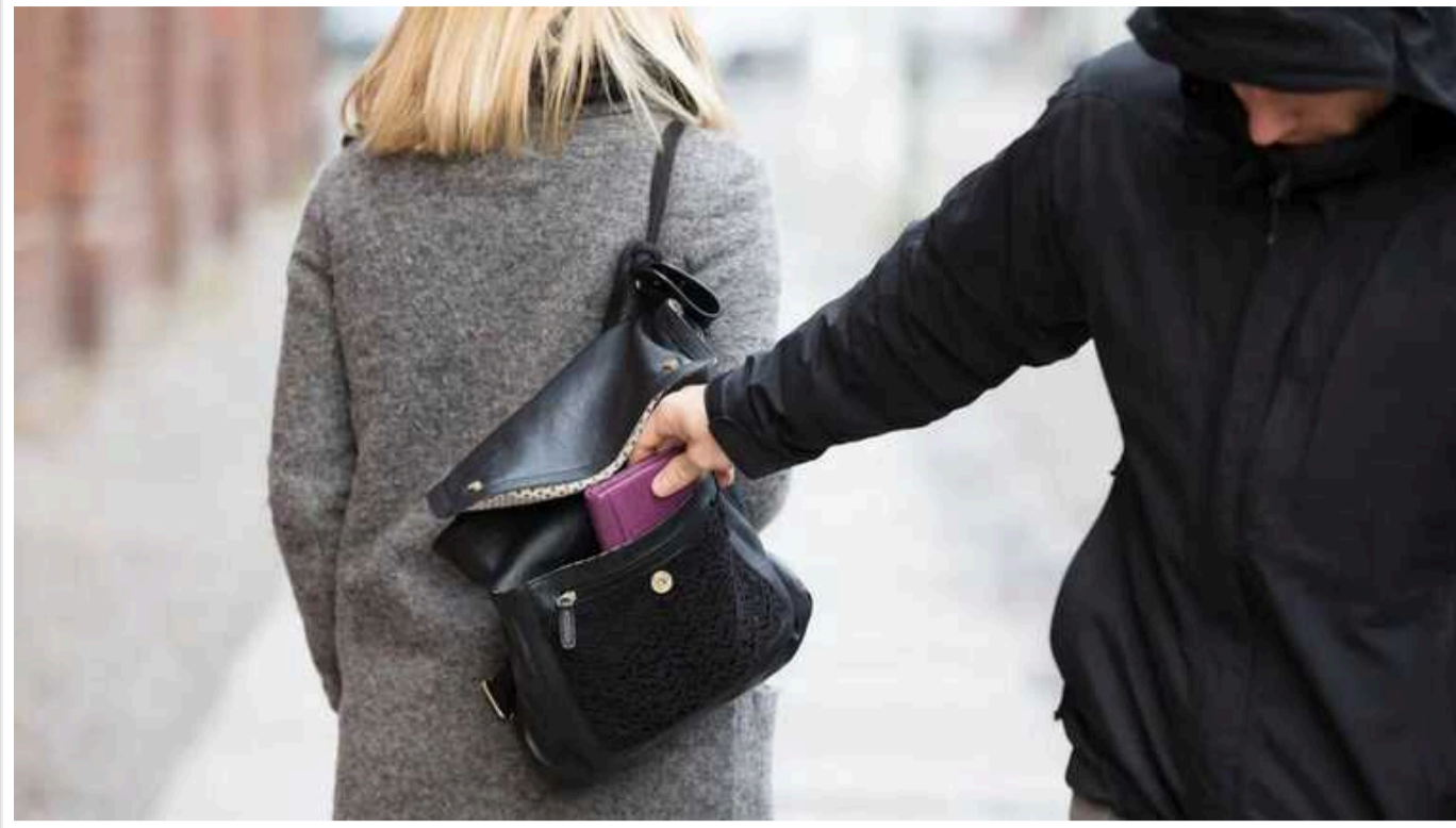
Депутати вдесятеро підвищили поріг для настання кримінальної відповідальності за крадіжки

Раніше крадіжка вважалася дрібною, якщо вартість майна на момент злочину не перевищувала 302,8 грн, а тепер поріг кримінальної відповідальності підвищили до 3028 грн.