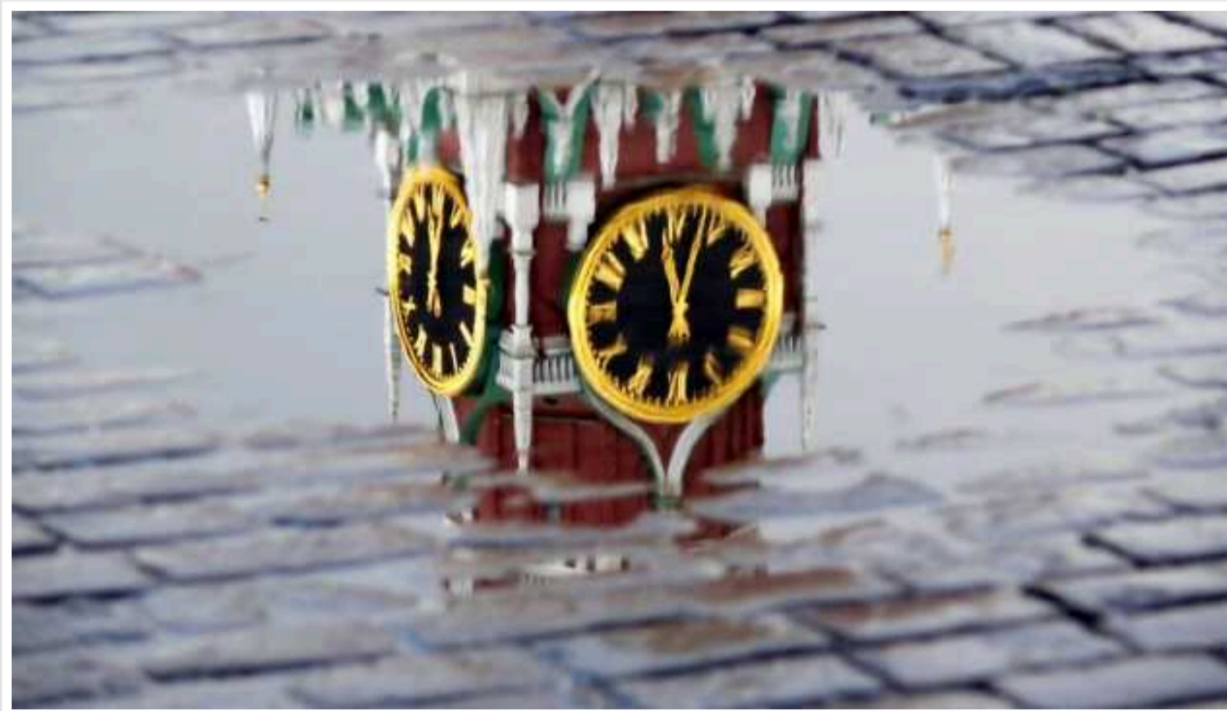
Британська розвідка розповіла, як у РФ обмежують доступ до правдивої інформації

Російська влада продовжує посилювати контроль над доступом до ЗМІ та інформації в РФ, насамперед обмежуючи використання цифрових телекомунікацій. Зафіксовано сповільнення трафіку в месенджері WhatsApp та спостерігаються перебої в роботі відеоплатформи YouTube.