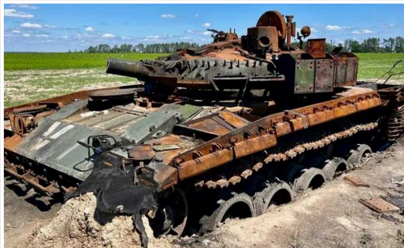
Українські прикордонники влучно відпрацювали на Харківському напрямку по ворожому танку

Українські прикордонники продовжують нищити техніку російської окупаційної армії на фронті. Нещодавно бійці ДПСУ спалили ворожий танк.