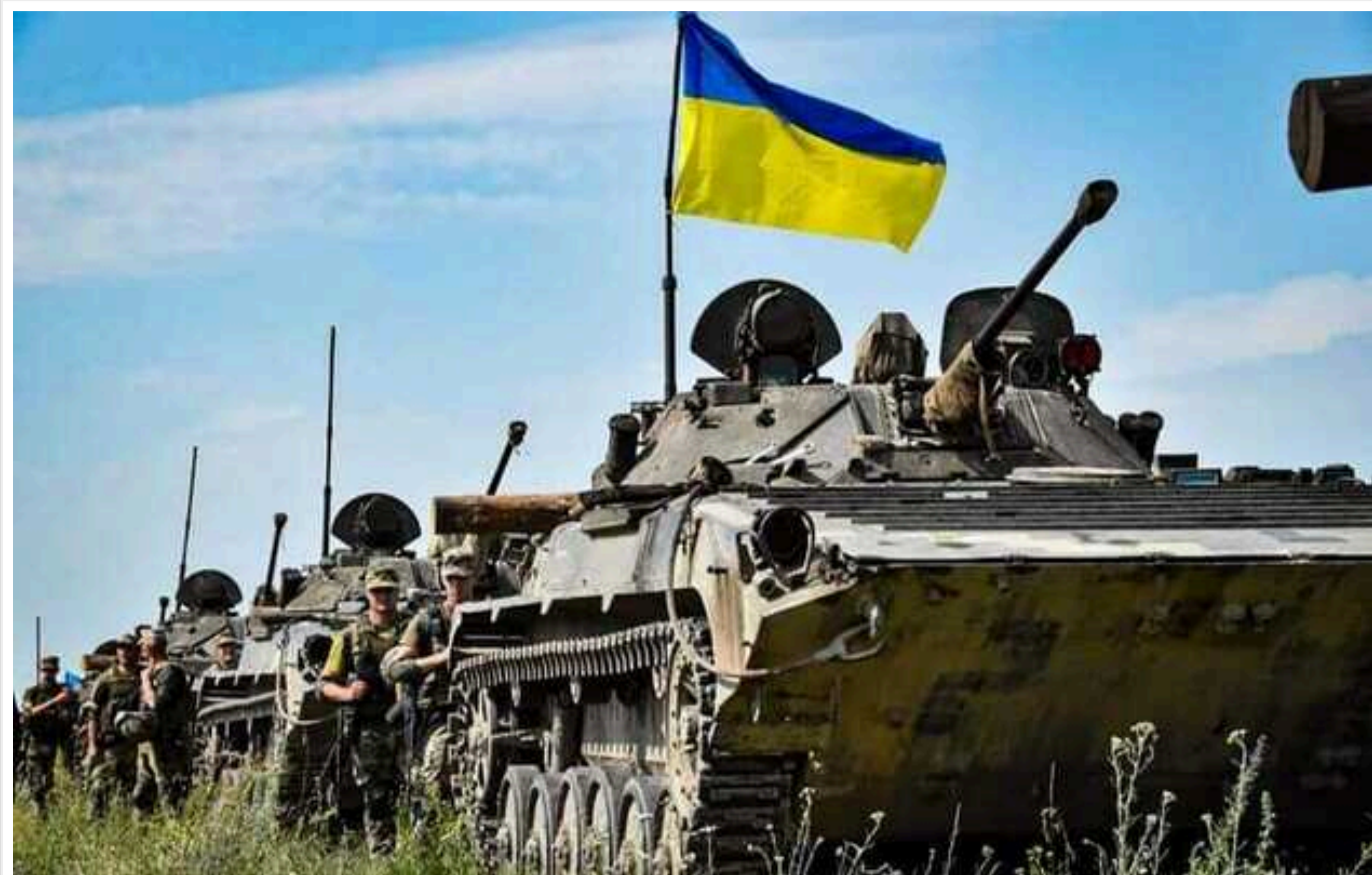
Пік наступу окупантів минув: найстрашніша ситуація на фронті вже позаду, – Дикий

Він зауважив, що ситуація на фронті, хоча й повільно, але буде змінюватися на нашу користь.