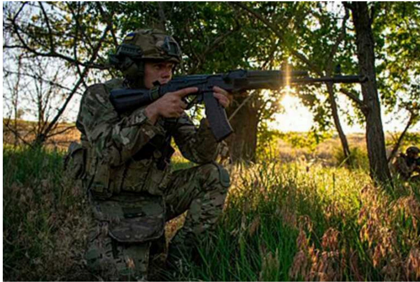
Речник ОСУВ "Таврія" каже, що в Кринках "ситуація не така критична"

Українські війська продовжують тримати оборону в районі населеного пункту Кринки. Наразі ситуація на даному напрямку є іншою, ніж її інтерпретують деякі медіа та блогери.