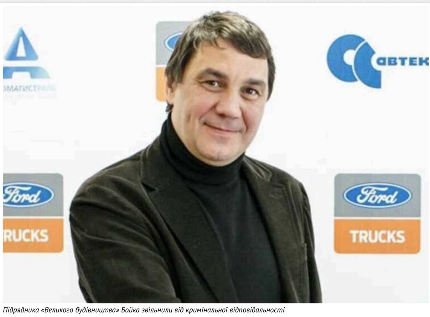
Підрядника «Великого будівництва» Бойка звільнили від кримінальної відповідальності

Брата віцепрезидента Національної асоціації дорожників України Олександра Бойка, засновника «Автомагістраль-Південь» та «Шляховик-97», які є одними з найбільших підприємців «Великого будівництва», звільнили від кримінальної відповідальності за підробку документів та ухилення від сплати податків.