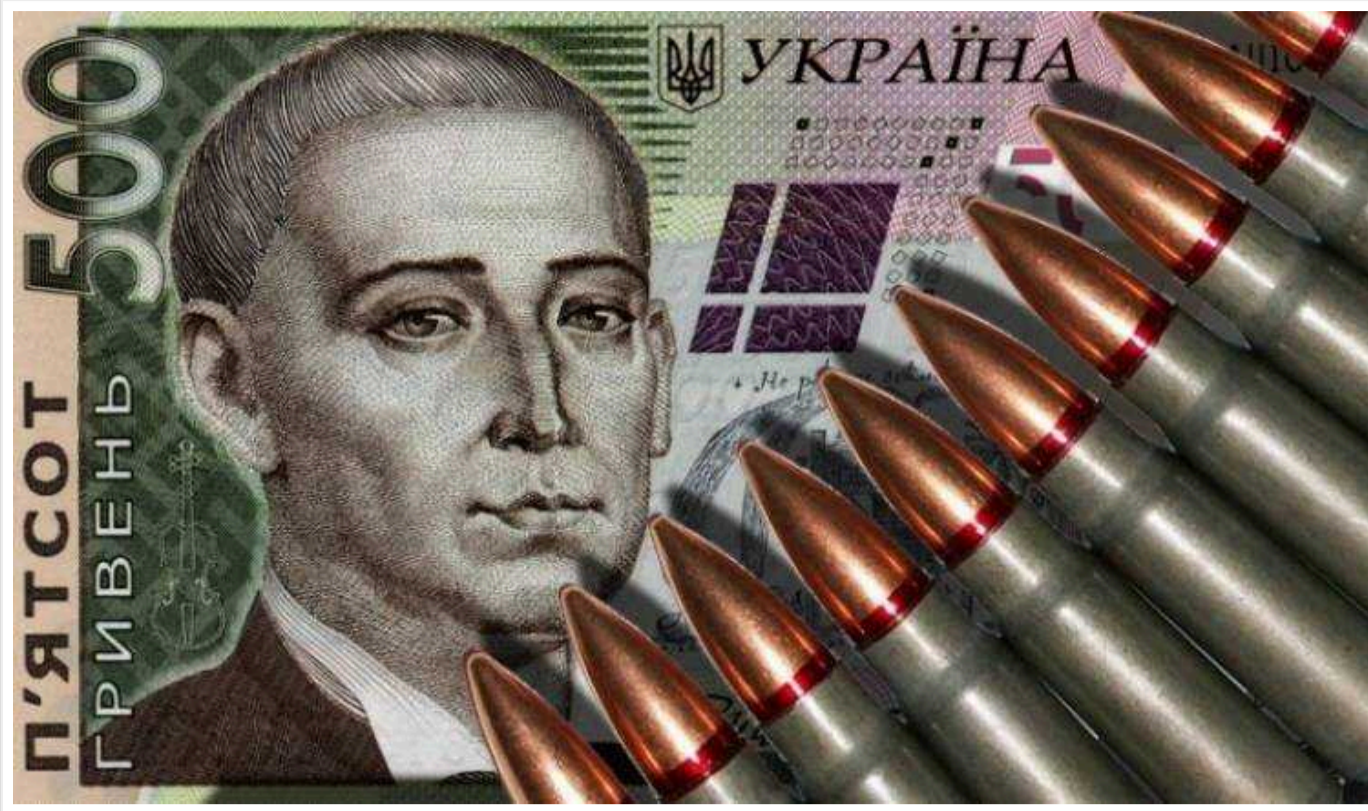
Кабмін планує збільшення військового збору з 1,5% до 5%, – нардеп