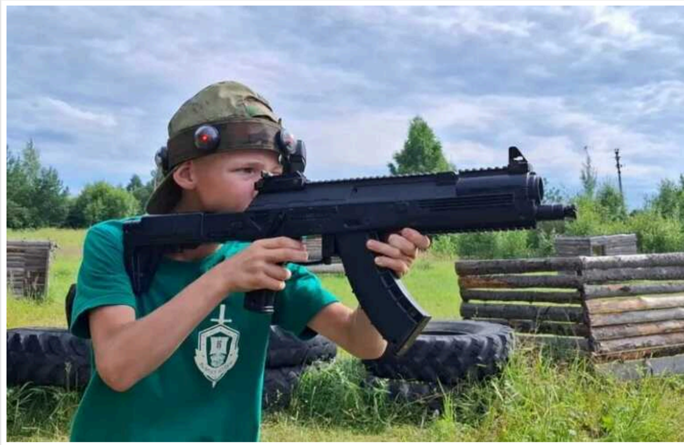
В РФ у школи закуповують макети поранених солдатів, щоб навчати дітей «виживати на війні»

У школах країни-агресора РФ з вересня 2024 року замість уроків ОБЖ («Основи безпеки життєдіяльності») вводять новий предмет – «Основи безпеки і захисту Батьківщини». Викладатимуть його окупанти, які воювали проти України, а для проведення уроків навчальні заклади закуповують макети поранених солдатів, мін, укриттів та радіометрів, щоб навчати дітей виживати на війні.