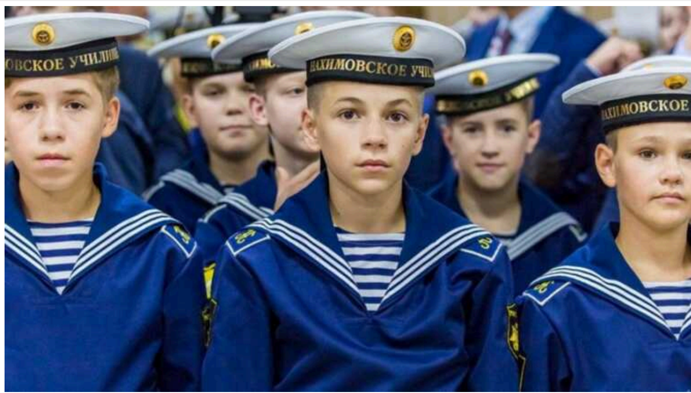
На ТОТ школярів вербують у філію нахімовського училища

Загарбники вербують школярів із тимчасово окупованих територій до філії нахімовського військово-морського училища.