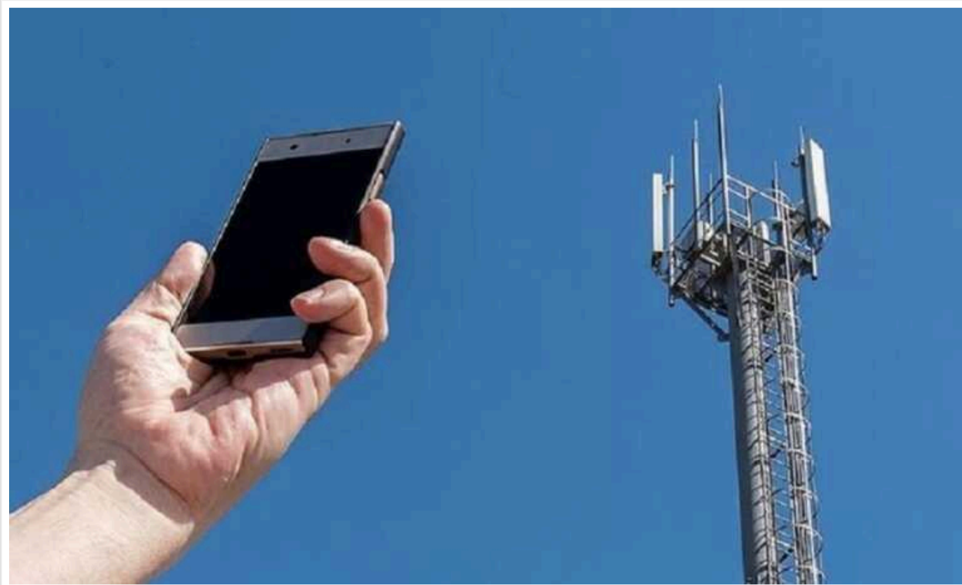
Мобільних операторів зобов'язали забезпечити 10 годин зв'язку без світла

Національний центр оперативно-технічного управління мережами телекомунікацій (НЦУ) зобов'язав операторів мобільного зв'язку забезпечити працездатність мереж в умовах планового або аварійного відключення електропостачання. Мобільний зв'язок має бути мінімум 10 годин без світла.