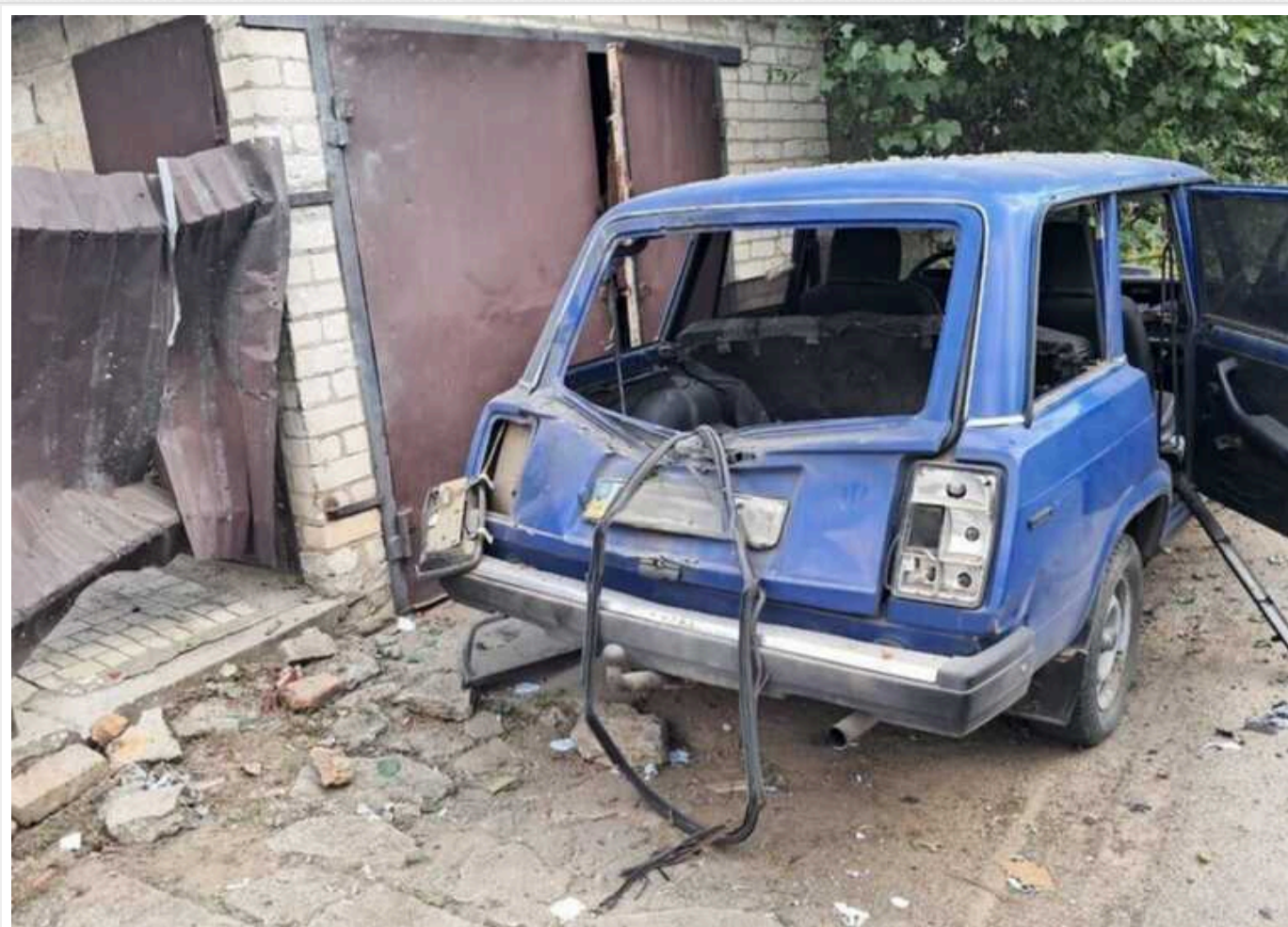
Окупанти понад 20 разів атакували Нікопольщину з артилерії та дронами-камікадзе

Протягом дня 17 липня російські війська атакували Нікопольський район Дніпропетровської області понад два десятки разів. Били артилерією та здебільшого - дронами-камікадзе.