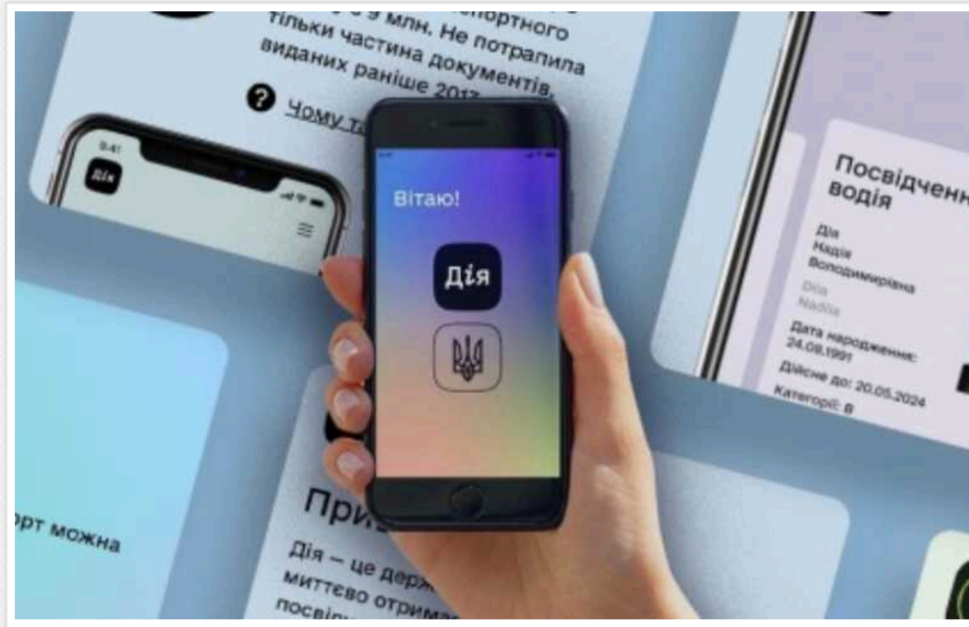
Через "Дію" тепер можна оформити бронь, - Мінекономіки

Зробити це можуть керівники критично важливих підприємств.