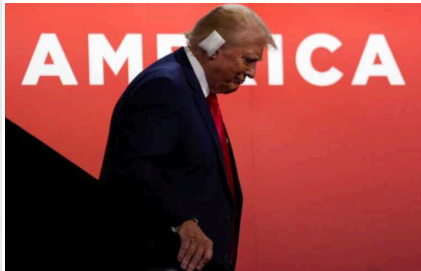
Politico: У США розвідка не виключає нових замахів на Трампа в найближчі тижні

За словами двох високопосадовців, знайомих із розвідданими, адміністрація Джо Байдена збрала з різних джерел інформацію про погрози з боку Ірану, пов'язані з актами фізичного насильства, які «можуть призвести до загибелі Трампа».