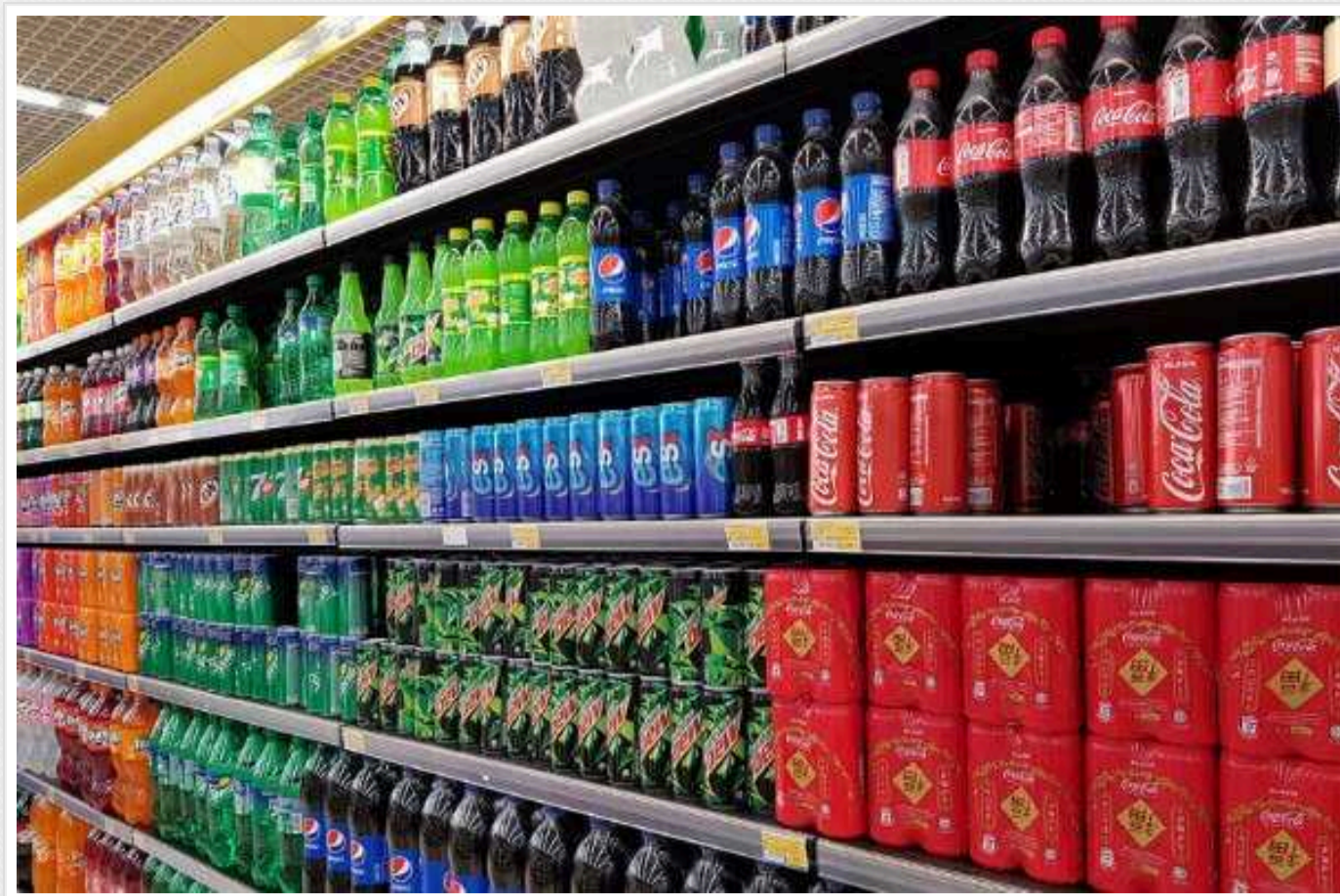
Ціна на газовані напої зростає в 2,5 рази, - нардеп