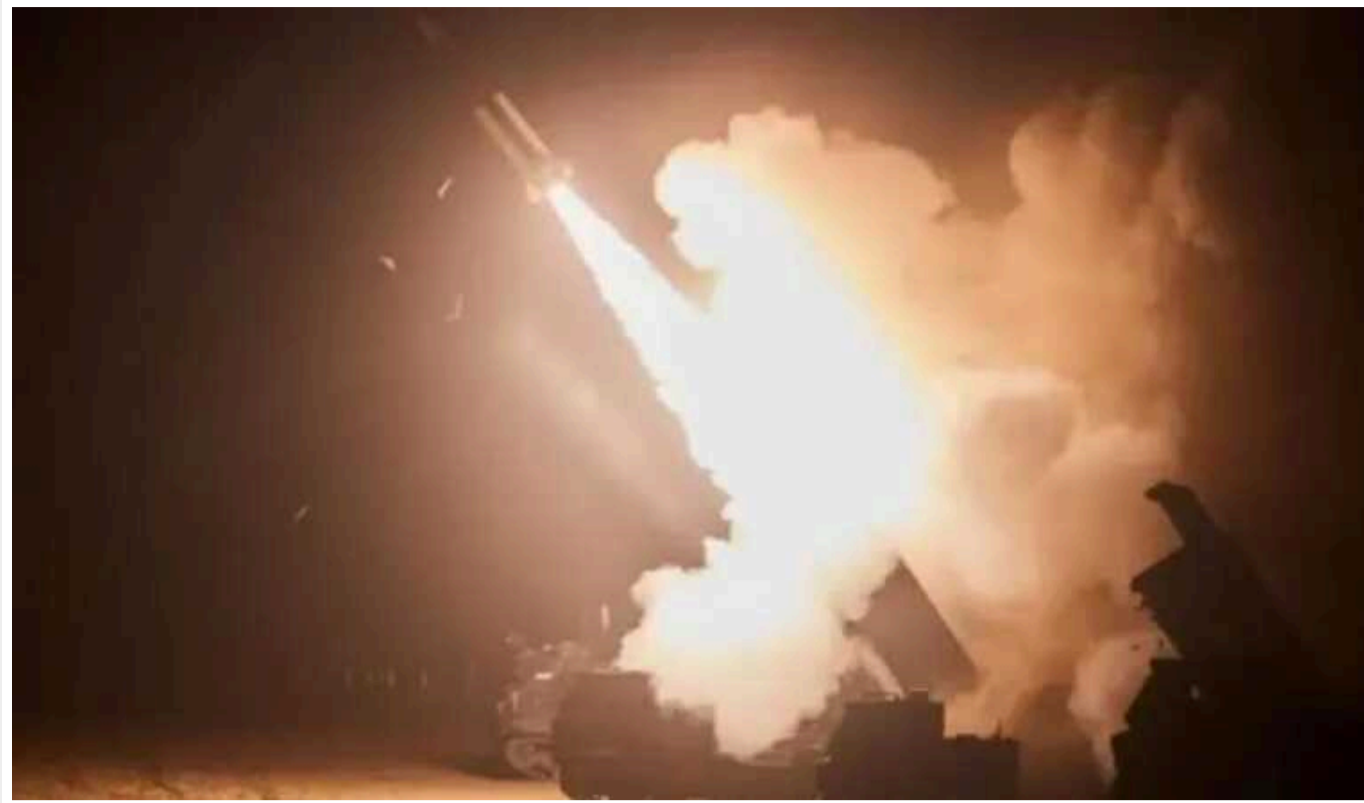
Генштаб підтвердив удар АТАСМС по С-300 під Маріуполем

Упродовж чотирьох днів росіяни втратили два комплекси ППО, які стояли під Маріуполем. Українське командування пояснило, що таким способом ЗСУ готуються до прибуття нових літаків. Кілька українських ракет дісталися до поля під Маріуполем, на якому стояли установки протиповітряної оборони ЗС РФ ЗРК С-300.