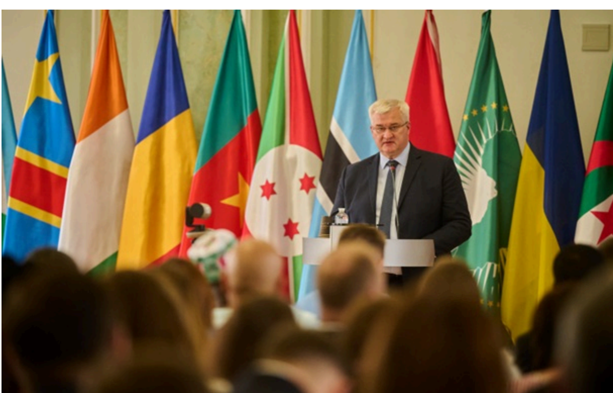
Андрій Сибіга на форумі Україна – Африка

Україна збирається стати стратегічним партнером для сталого розвитку Африки через концепцію "трьох стовпів".