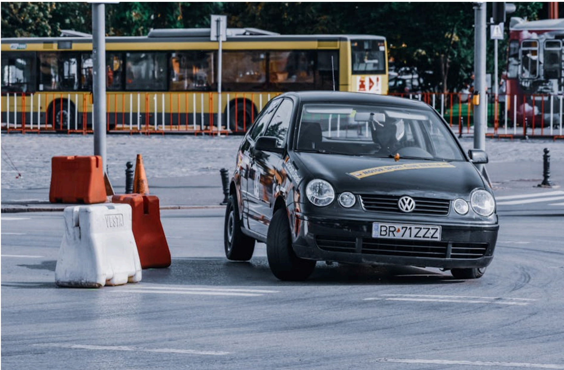
Водійські права

ДМИТРУК АНДРІЙ — 27 Травня 2026, 00:28 1 Min Read — АВТО