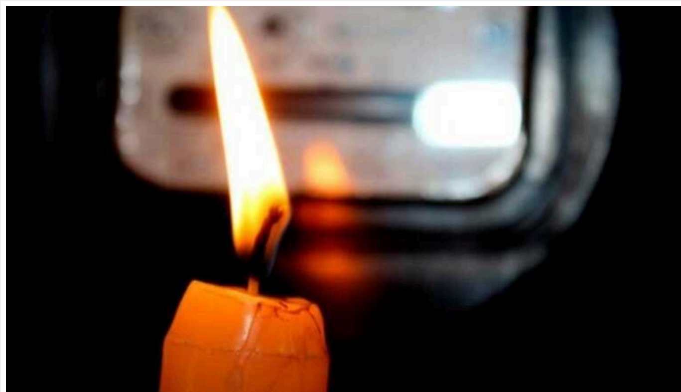
В Україні посилили графіки відключення електроенергії

В Україні 17 липня електроенергію відключатимуть протягом доби. При цьому з 11:00 до 22:00 світла може не бути в період "можливих відключень" згідно з графіками (т.зв. сірі зони). Спочатку передбачалося, що жорсткі відключення розпочнуться лише з 17:00. Також франці 17 липня було скасовано екстрені відключення (не за графіками).