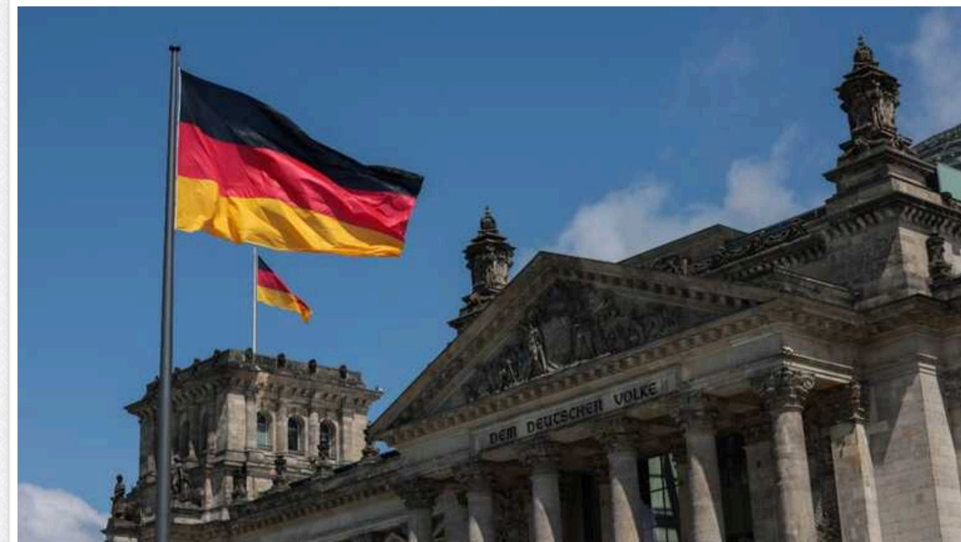
Німеччина вдвічі скоротить військову допомогу Україні, – Reuters

У Німеччині в 2025 році вдвічі скоротять військову допомогу Україні – з 8 до 4 млрд євро.