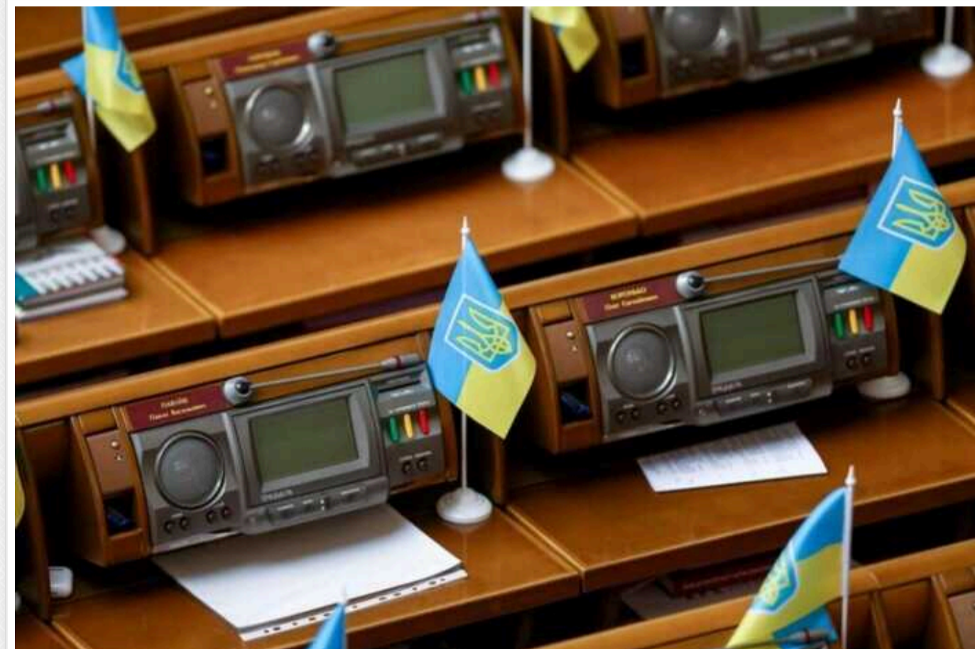
Народні депутати беруть з бюджету компенсацію на оренду житла, а самі витрачають статки на автівки та Rolex, – ЗМІ

Держава витратила 64,5 мільйона гривень на компенсації за оренду житла для народних депутатів, тоді як деякі з них витрачають значні суми на коштовності та елітні автівки. Наприклад, нардеп Сергій Лабазюк ("За майбутнє") отримав 316,5 тисячі гривень компенсації, водночас купуючи Rolex за майже 400 тисяч гривень і нові автомобілі, грабуючи державний бюджет.