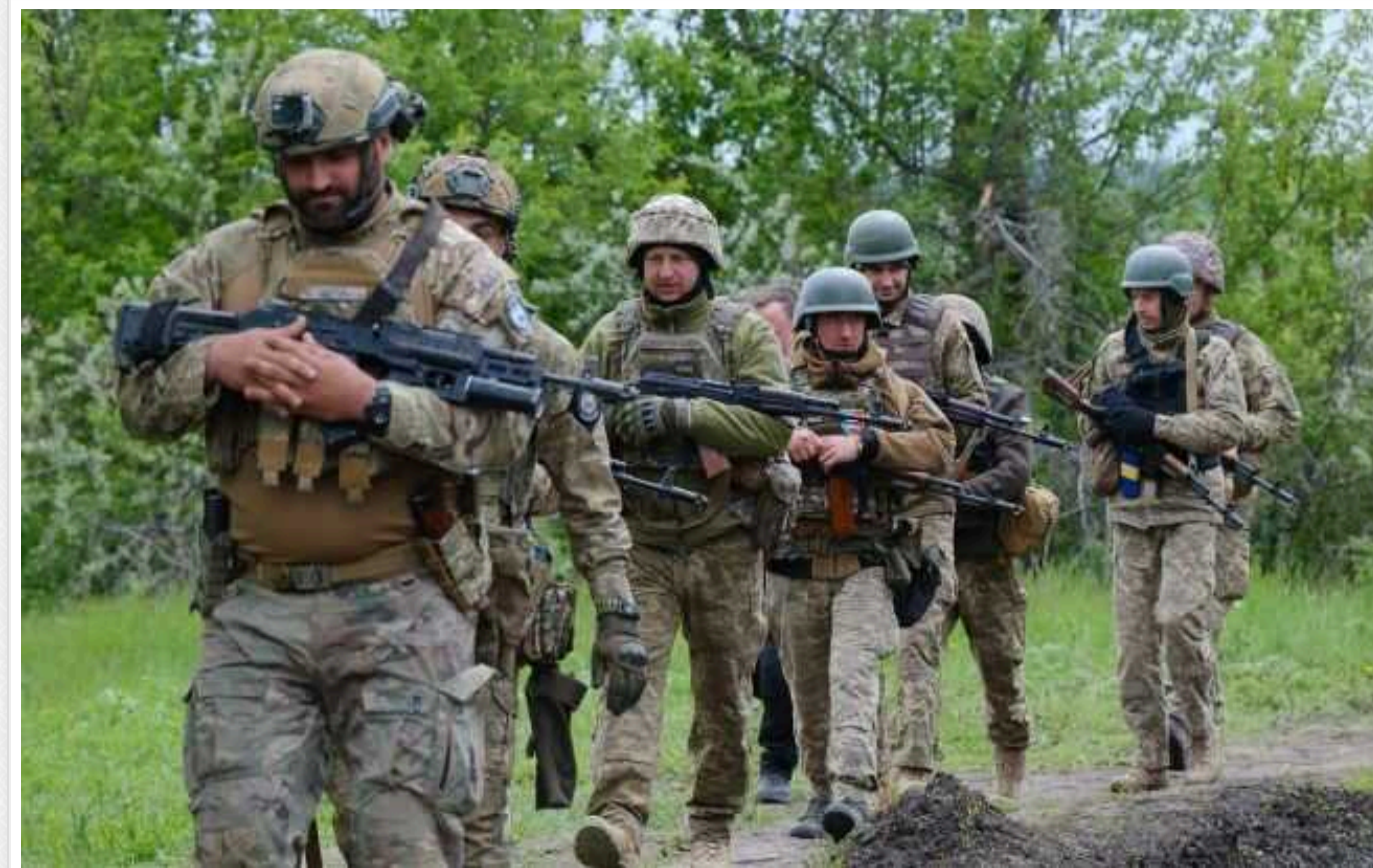
У ЗМІ розповіли, як воюють у лавах ЗСУ мобілізовані колишні ув'язнені

Засуджені, яких звільнили з місць відбування покарання для захисту України, демонструють успіх на полі бою. У травні Рада дозволила застосовувати до ув'язнених умовно-дострокове звільнення для проходження військової служби за контрактом.