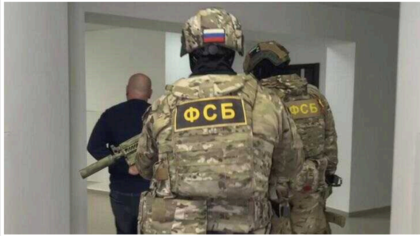
Розвідка Британії пояснила, як у Росії шукають шляхи запобігання виїзду з країни потенційних призовників

Російський уряд розробляє механізм, щоб запобігти виїзду з країни потенційних призовників і мобілізованих. Очікується, що відповідна система буде готова до осені нинішнього року.