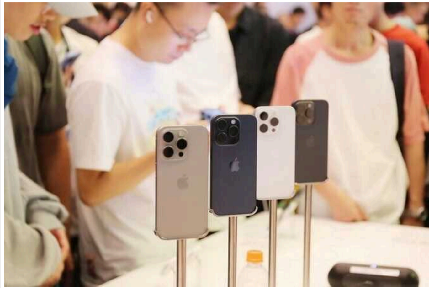
Розкш і контрабанда: як нелегальні iPhone заповнили Україну

З різницею у кілька днів голови двох ключових комітетів парламенту - бюджетного та фінансового, окреслили одну з головних проблем економіки країни та одразу знайшли її вирішення.