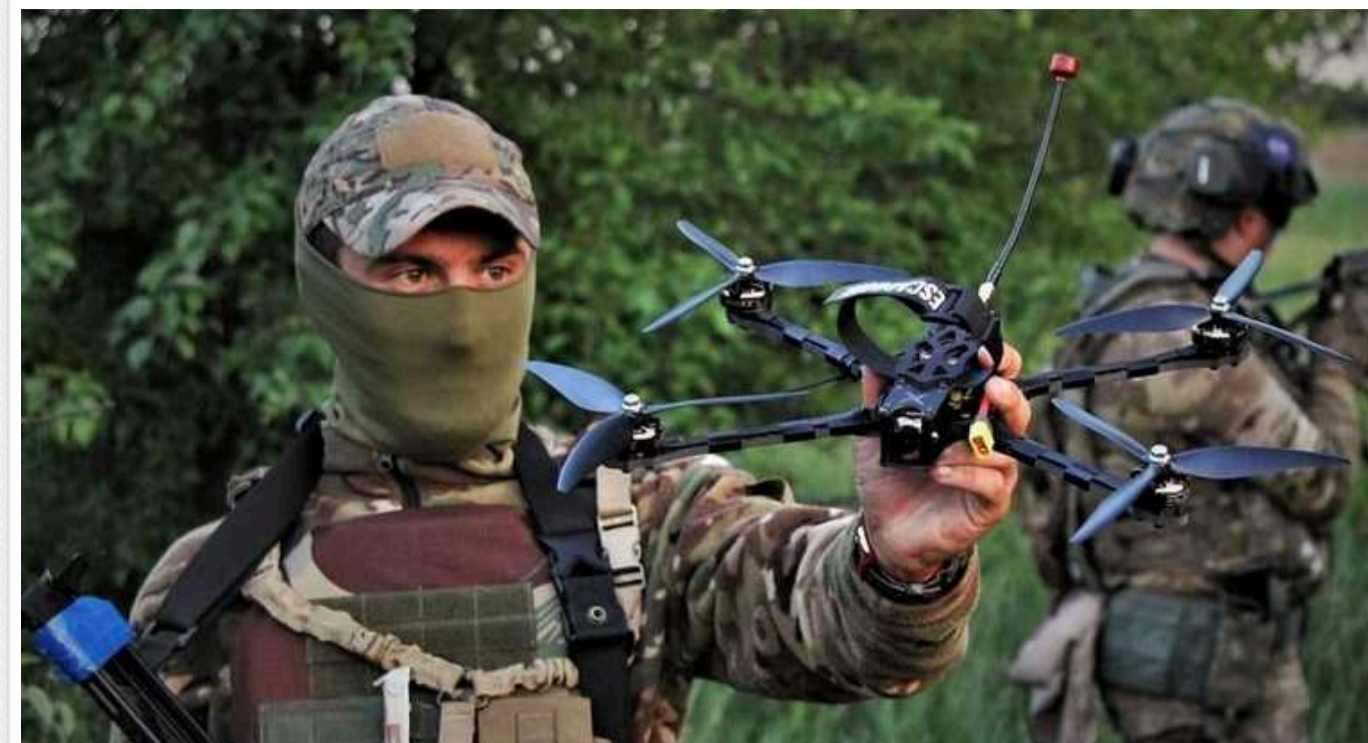
Україна створює самодостатню базу: «Мільйон FPV та 80-100 тисяч боєприпасів 155 мм на місяць», – ISW

За словами аналітиків, Іспанія розпочала передачу Києву 10 відремонтованих танків Leopard, 20 липня вони прибудуть до Польщі, а згодом – до України. Литва анонсувала постачання обладнання для РЕБ та стрільцькі патрони натовського зразка.