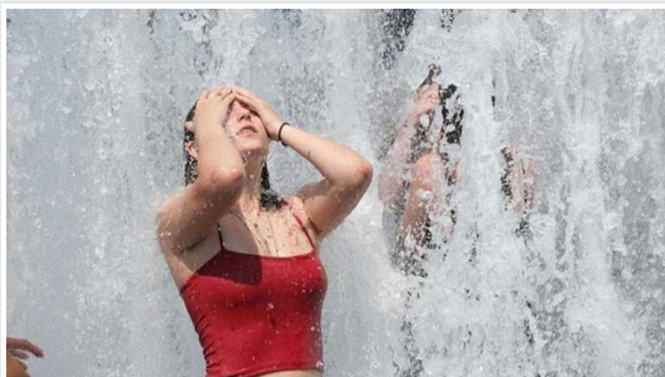
Синоптики спостерігають небачену за всю історію спостережень температуру повітря в Україні та Європі

Рекордні температури повітря в Україні та Європі останнім часом все частіше призводять до одного з найбільш небезпечних станів – теплового удару, який може стати причиною смерті. За даними Всесвітньої метеорологічної організації, синоптики нині спостерігають небачену за всю історію спостережень температуру повітря, яка сягає понад 48°C.