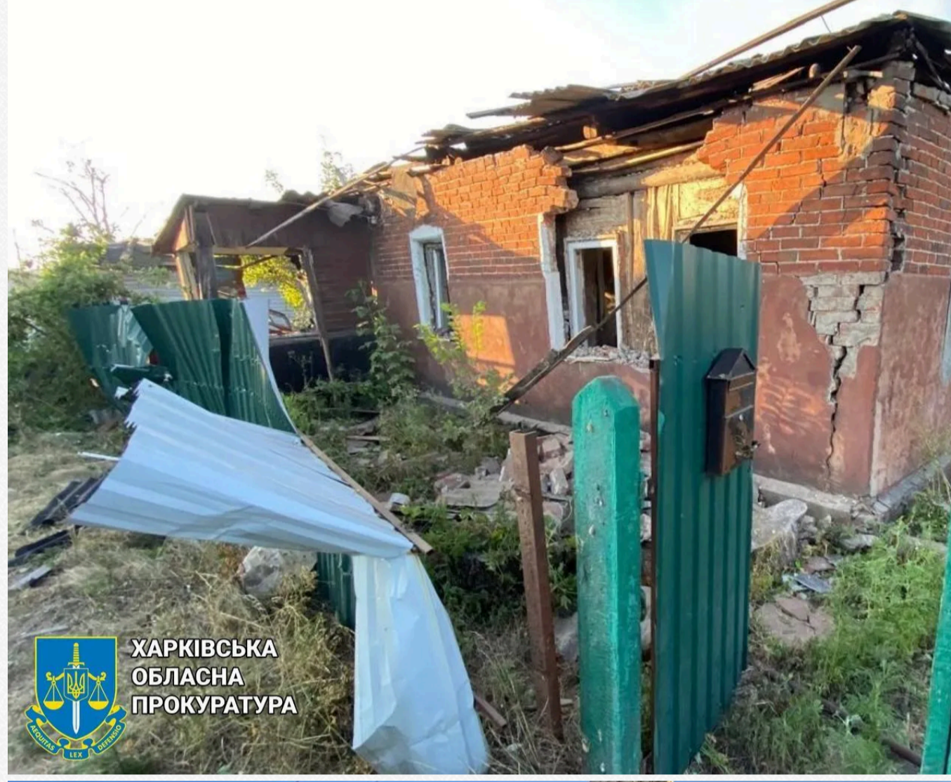
ХАРКІВСЬКА ОБЛАСНА ПРОКУРАТУРА

У вказаних населених пунктах пошкоджено приватні домоволодіння та господарчі приміщення. Прокурори та слідчі повністю вживають всіх можливих та належних заходів для документування воєнних злочинів, вчинених російськими військовослужбовцями, — зазначено у повідомленні.