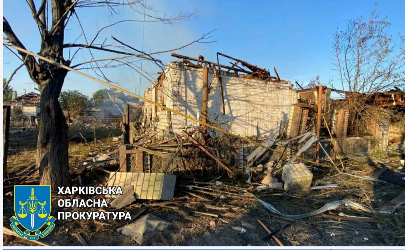
ХАРКІВСЬКА ОБЛАСНА ПРОКУРАТУРА