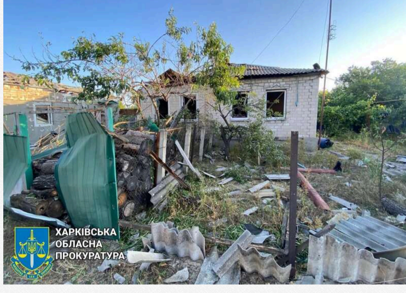
ХАРКІВСЬКА ОБЛАСНА ПРОКУРАТУРА