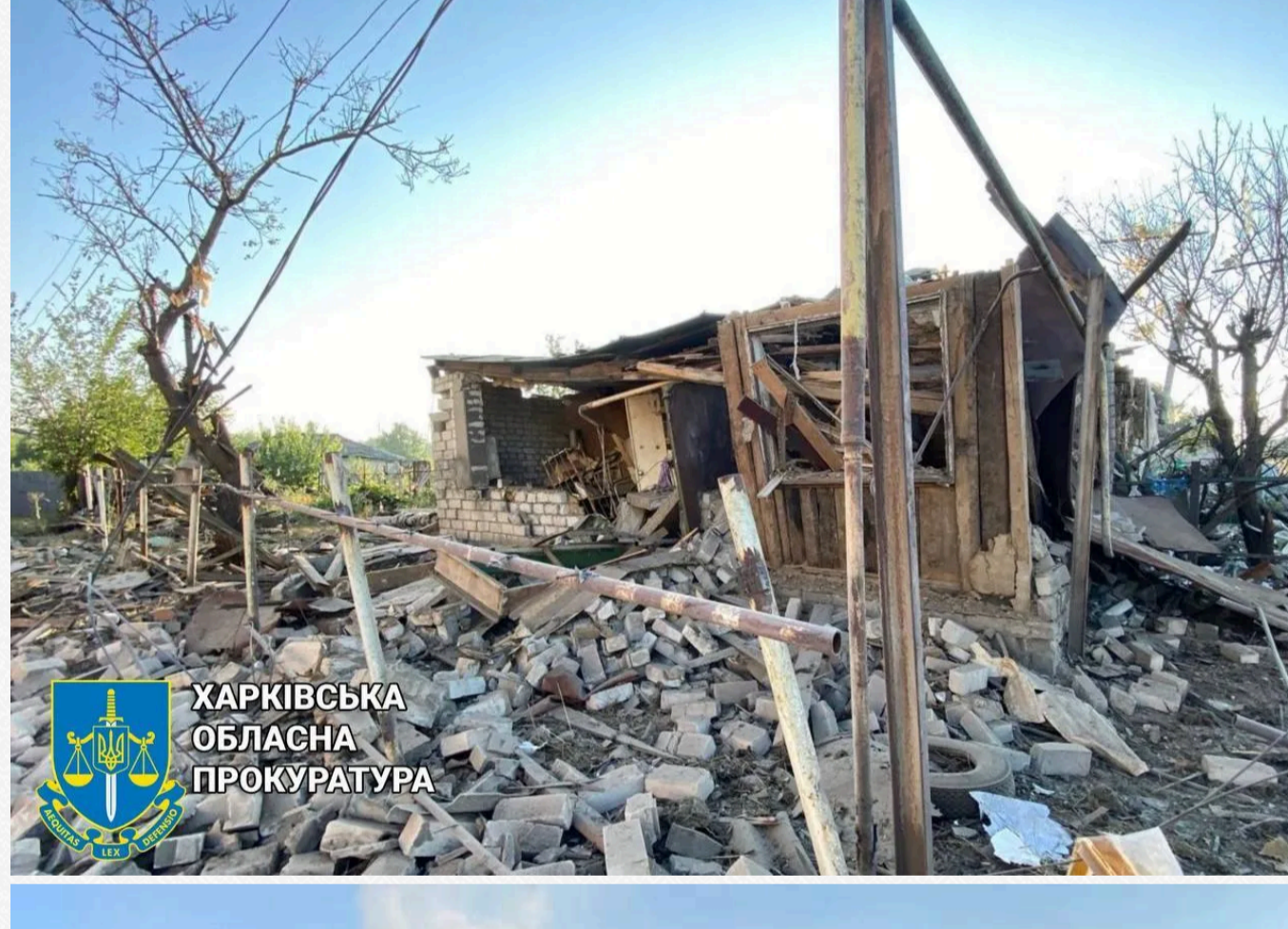
ХАРКІВСЬКА ОБЛАСНА ПРОКУРАТУРА