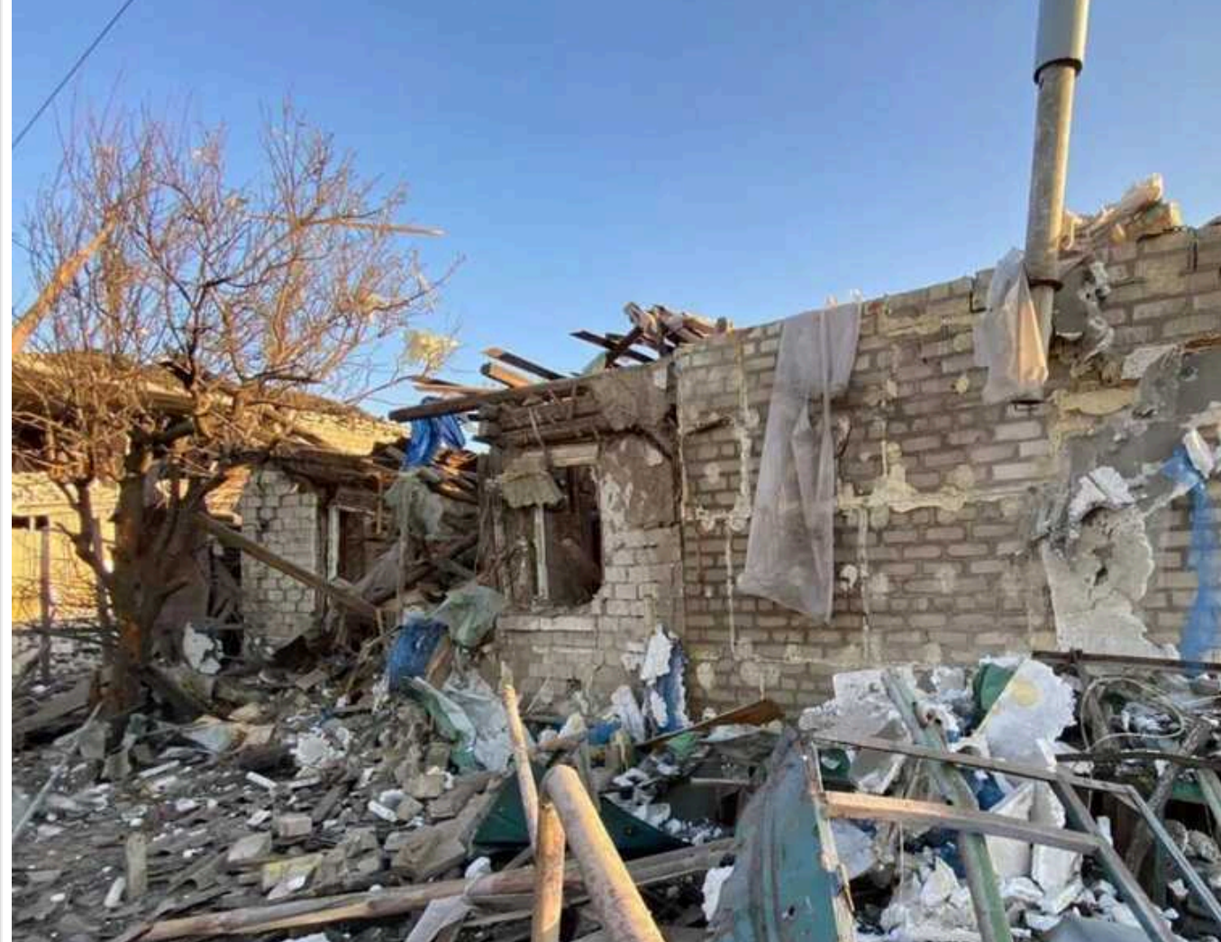
На Харківщині внаслідок ворожих ударів загинула одна людина

Російські війська продовжують атакувати цивільне населення на Харківщині. Напередодні, 15 липня, під російськими обстрілами опинилися Вовчанськ та населені пункти Куп'янського району.