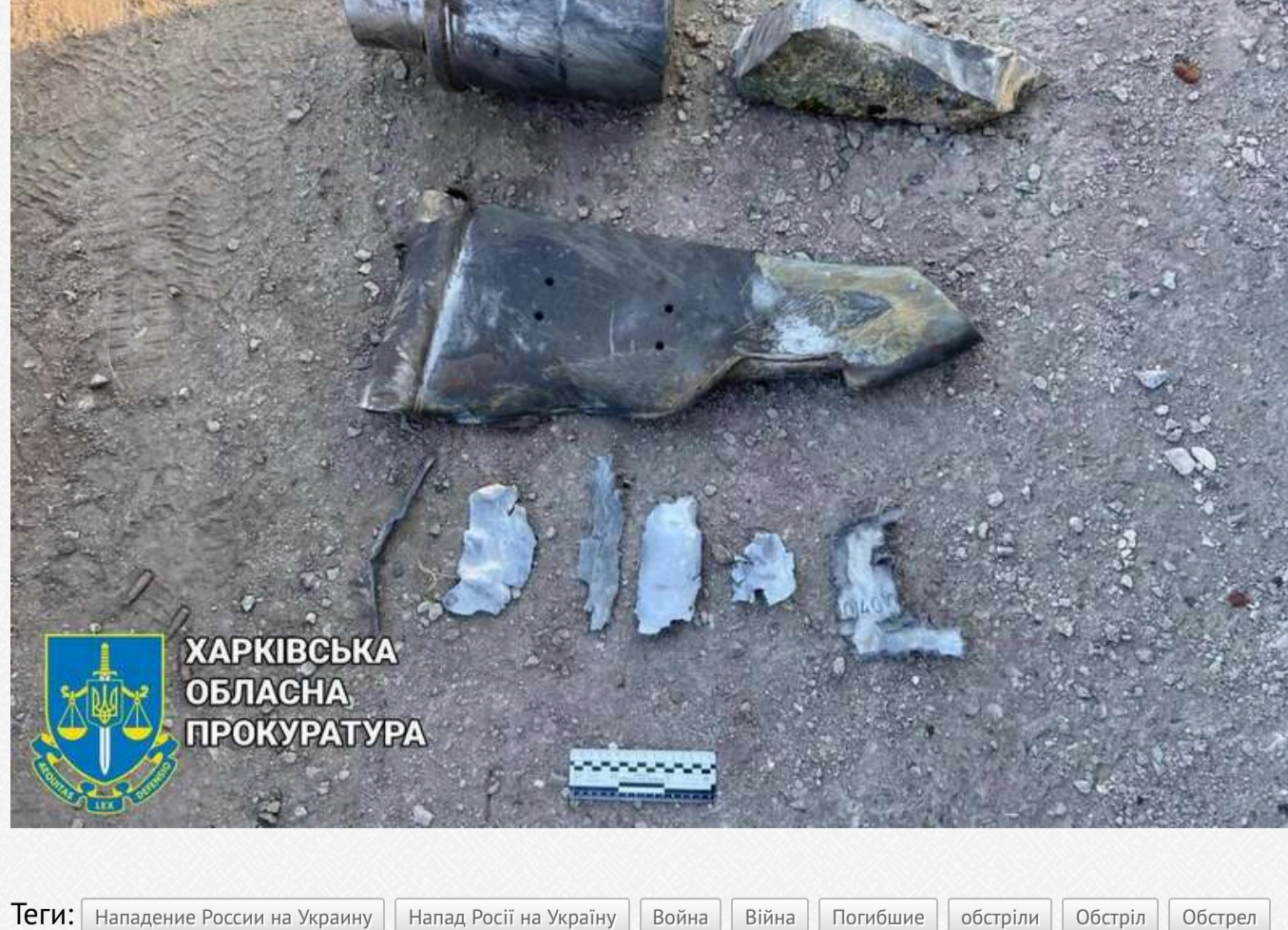
ХАРКІВСЬКА ОБЛАСНА ПРОКУРАТУРА

Теги: Нападження Росії на Україну, Напад Росії на Україну, Війна, Війна, Погоди, Обстріли, Обстріли, Обстріли