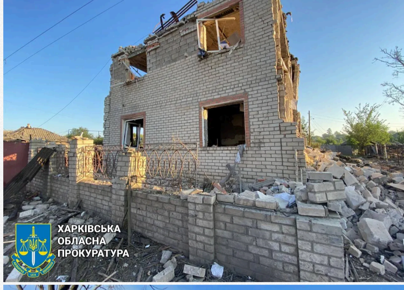
ХАРКІВСЬКА ОБЛАСНА ПРОКУРАТУРА