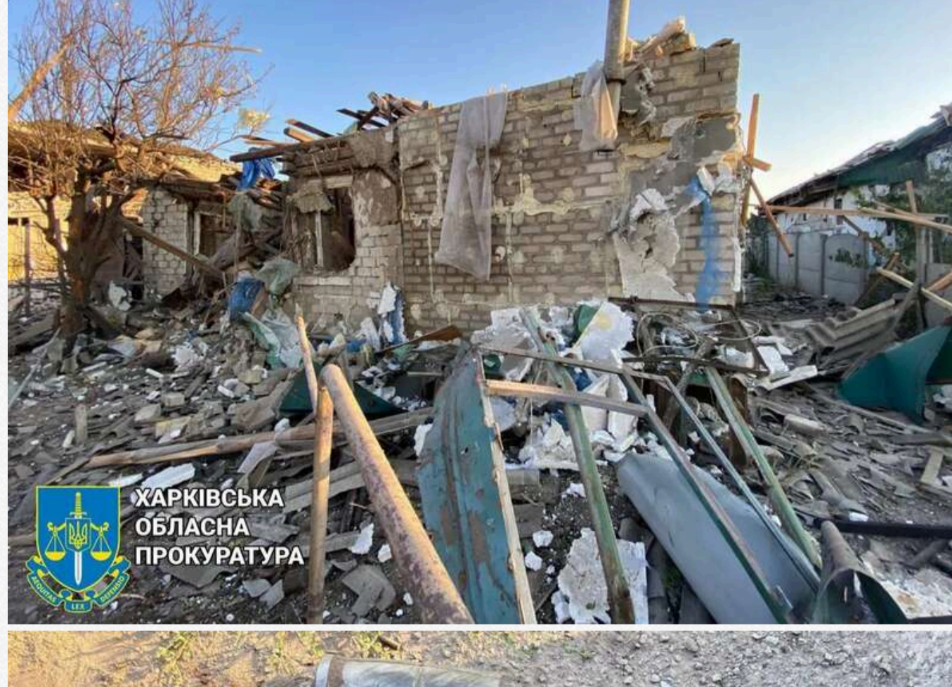
ХАРКІВСЬКА ОБЛАСНА ПРОКУРАТУРА