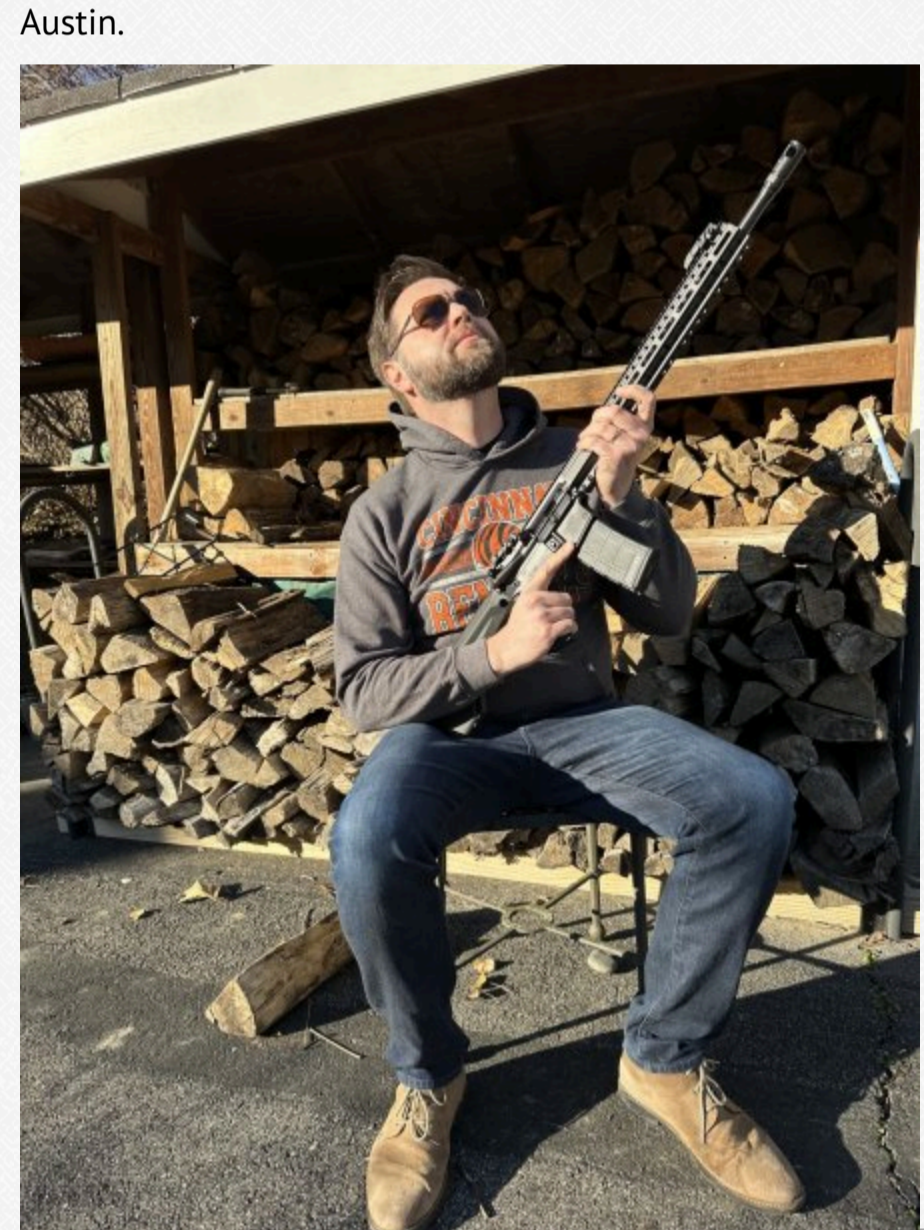
Джей Ді Венс зі зброєю

Після школи Венс служив у морській піхоті. Під час війни в Іраку він займався зв'язками з громадськістю. У 2007 році закінчив службу і вступив до університету штату Огайо. Там вивчився на політолога, а потім вступив до Єльської школи права. Потім працював у Кремнієвій долині в одній із найбільших юрфірм США – Sidley Austin.