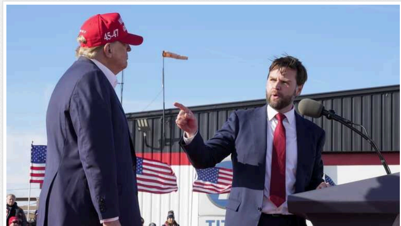
Кандидат Трампа на посаду віцепрезидента називав його Гітлером та ідіотом

Джеймс Девід Венс ще кілька років тому був одним із найзапекліших критиків Дональда Трампа, а тепер перетворився на його вірного соратника.