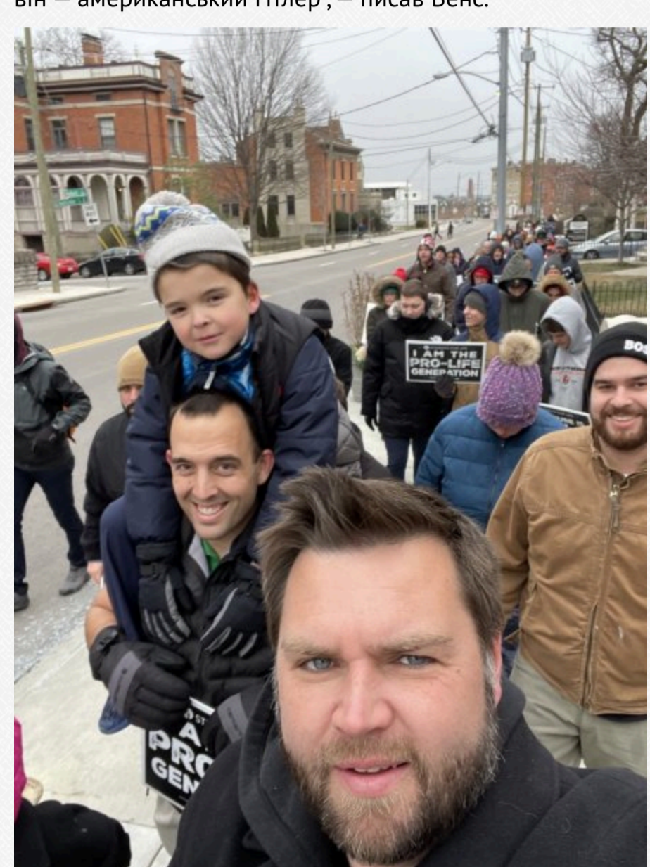
Джей Ді Венс на мітингу проти абортів

"Я метаюся між думками про Трампа як про цинічного придурка на кшталт Ніксона, який не був би таким уже й поганим (і навіть міг би виявитися корисним), і про те, що він – американський Гітлер", – писав Венс.