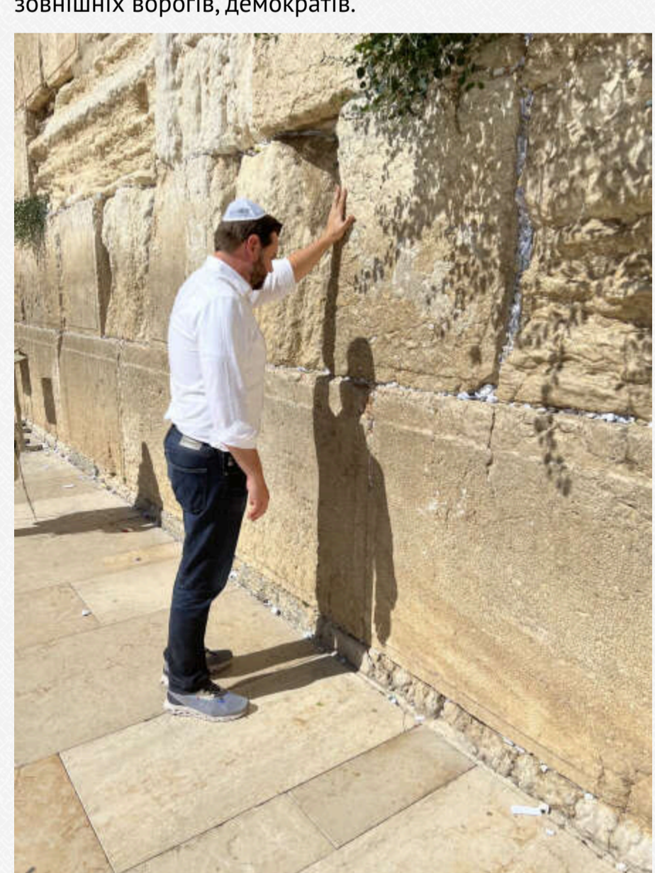
Джей Ді Венс в Ізраїлі

Венс став часто з'являтися в телешоу і намагатися пояснити, чим погана політика Трампа щодо білого робітничого класу. Венс вважав, що його риторика дає змогу людям перекласти провину за те, що відбувається, на когось іншого: іммігрантів, зовнішніх ворогів, демократів.