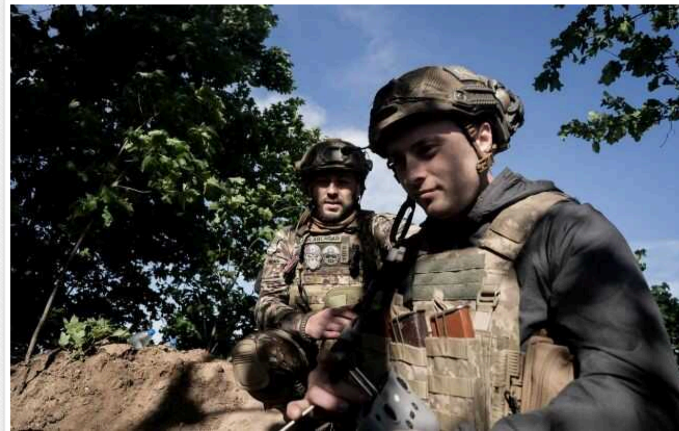
Окупанти почали рух на Сіверському напрямку і захопили деякі рубежі Сил оборони, – військовий

У Генштабі ЗСУ повідомили, що на цій ділянці фронту впродовж доби Сили оборони відбили 8 атак російських окупантів.