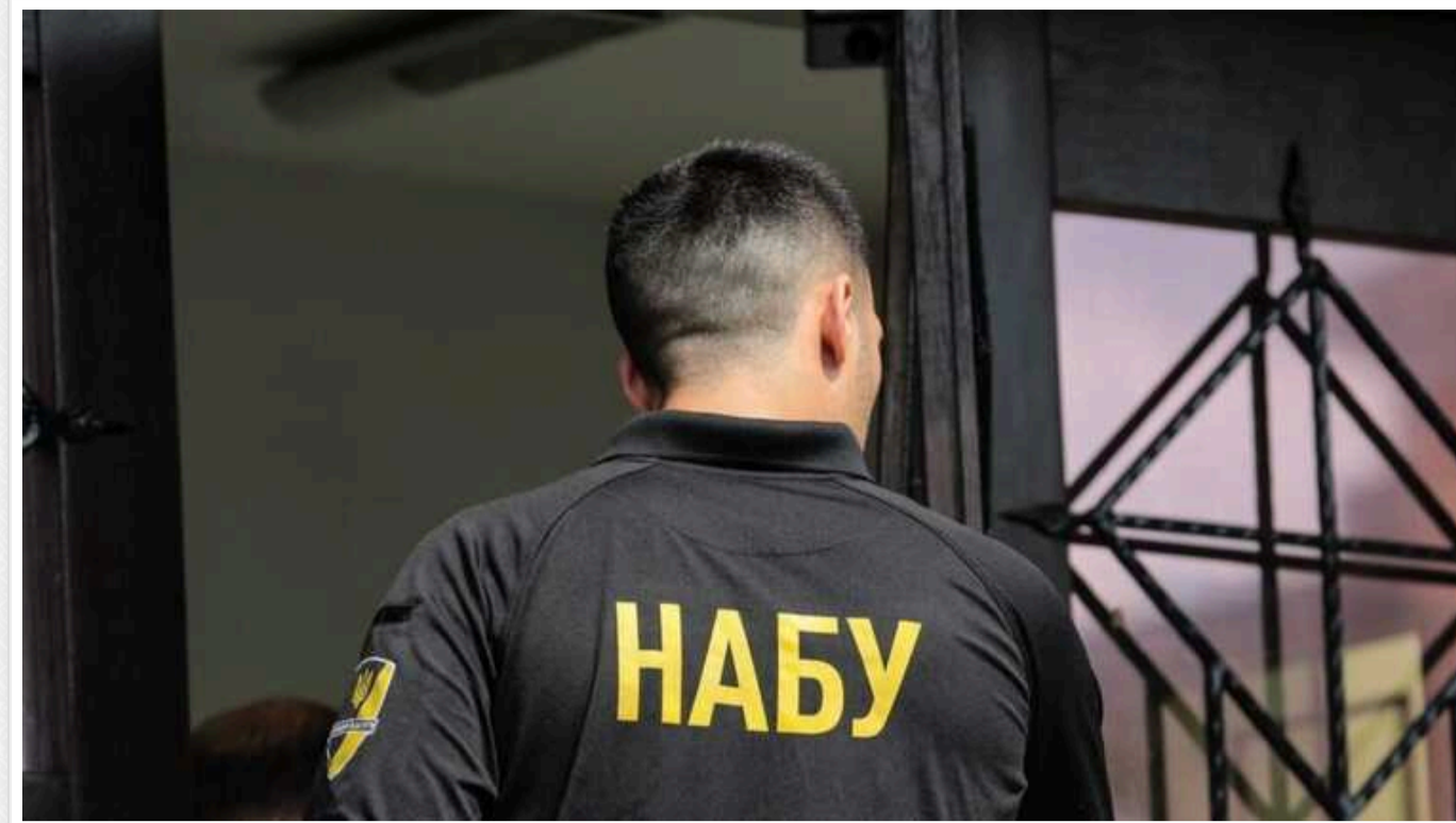
Прокурорів ОГП піймали на хабарі у 170 тисяч доларів за закриття справи

НАБУ і САП викрили прокурорів Офісу Генерального прокурора на одержанні неправомірної вигоди у розмірі 170 тис. дол. США за ухвалення рішення про закриття кримінального провадження.