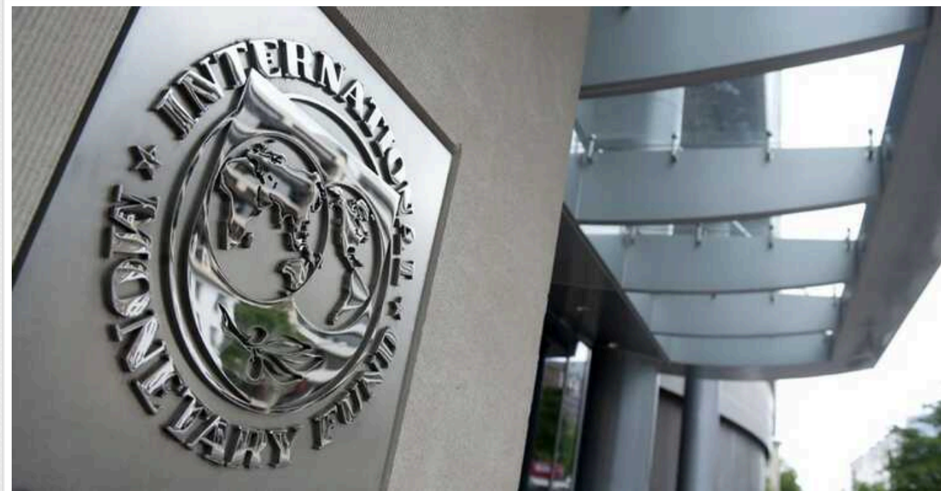
Представники МВФ прибули до Києва

16 липня у вівторок команда фахівців Міжнародного валютного фонду (МВФ) на чолі з керівником місії Фонду Гевіном Грем розпочинає зустрічі в Києві з представниками влади України та іншими партнерами. Обговорять бюджет та податки.