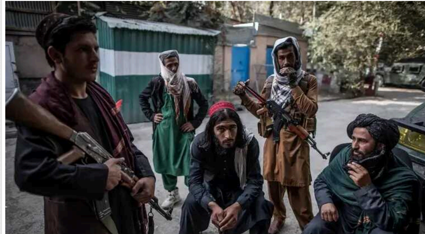
В ЄС думають над поверненням посольств до Афганістану. – Bloomberg

Певні країни Європейського Союзу розглядають можливість поновити роботу своїх посольств у Афганістані, де при владі перебуває терористичне угруповання "Талібан". Одна з таких країн – Італія.