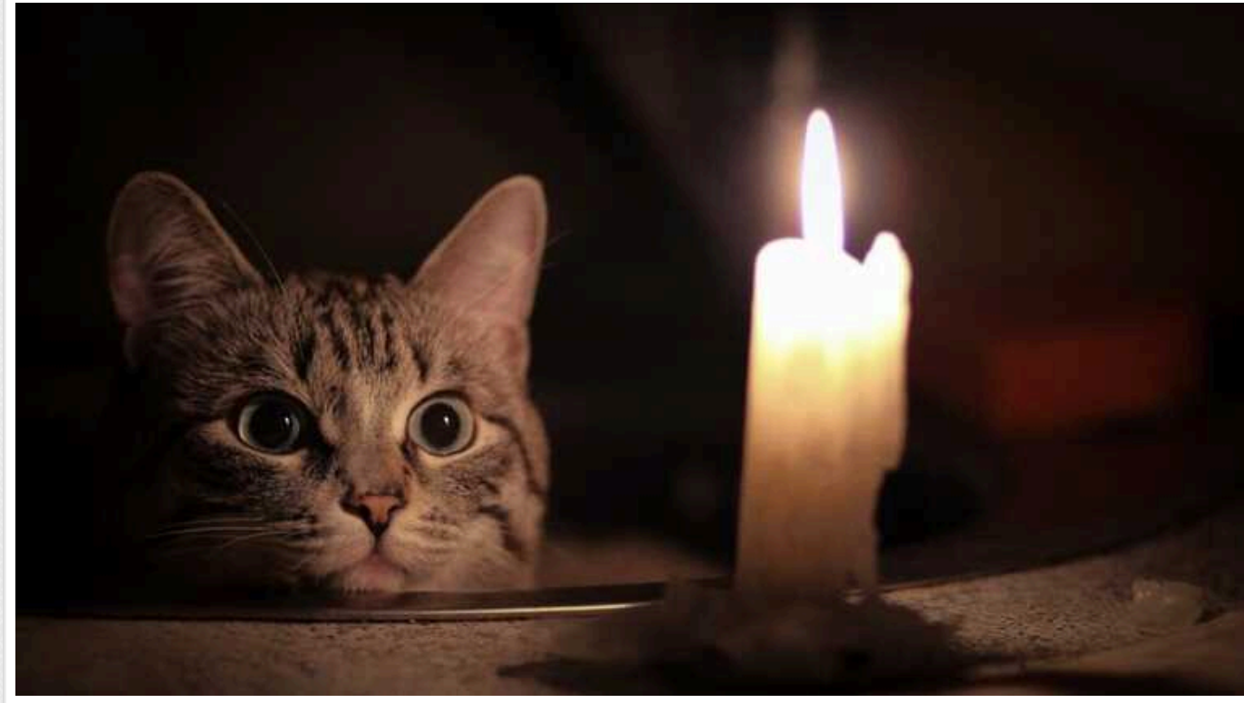
У низці областей запровадили аварійні відключення світла через аномальну спеку

В низці областей України через аномальну спеку та збільшення дефіциту в енергосистемі були запроваджені екстрені відключення світла.