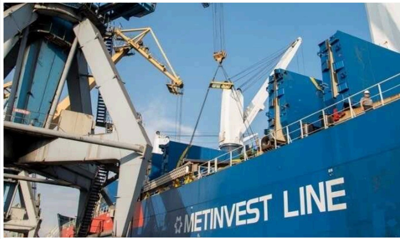
Збитки на 122 мільйони гривень: Як «економить» у порту «Південний» компанія «Метінвест»

Знаєте, що таке успішний бізнес України? Це коли для найбільшої приватної компанії країни «Метінвест» керівник порту «Південний» занижує комплексну ставку на навантаження експортної залізорудної сировини. «Економлячи» таким чином для приватника понад 120 млн гривень.