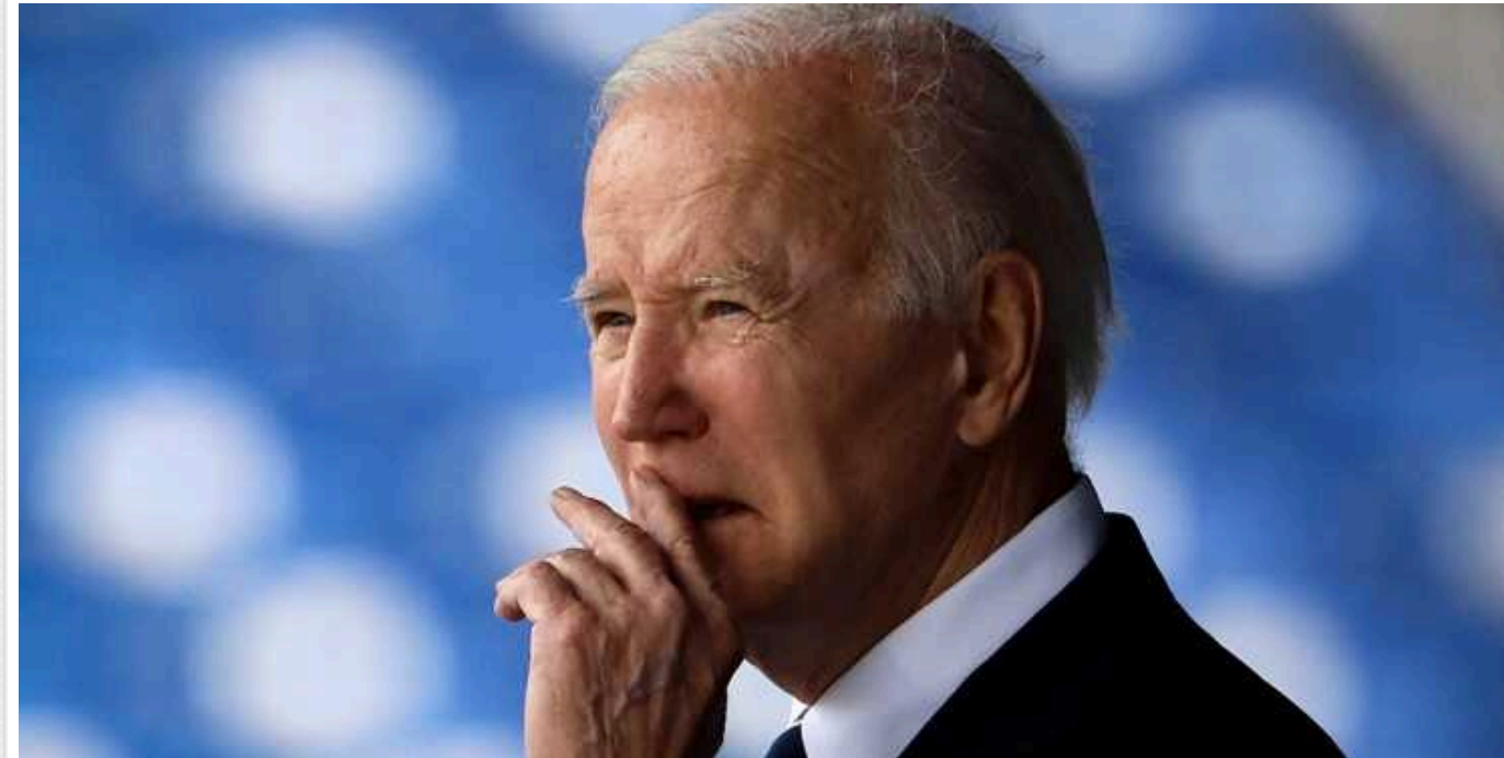
Байден пояснив слова, які сказав за тиждень до замаху на Трампа

Президент США Джо Байден виправдався за слова, які сказав за тиждень до замаху на Трампа.