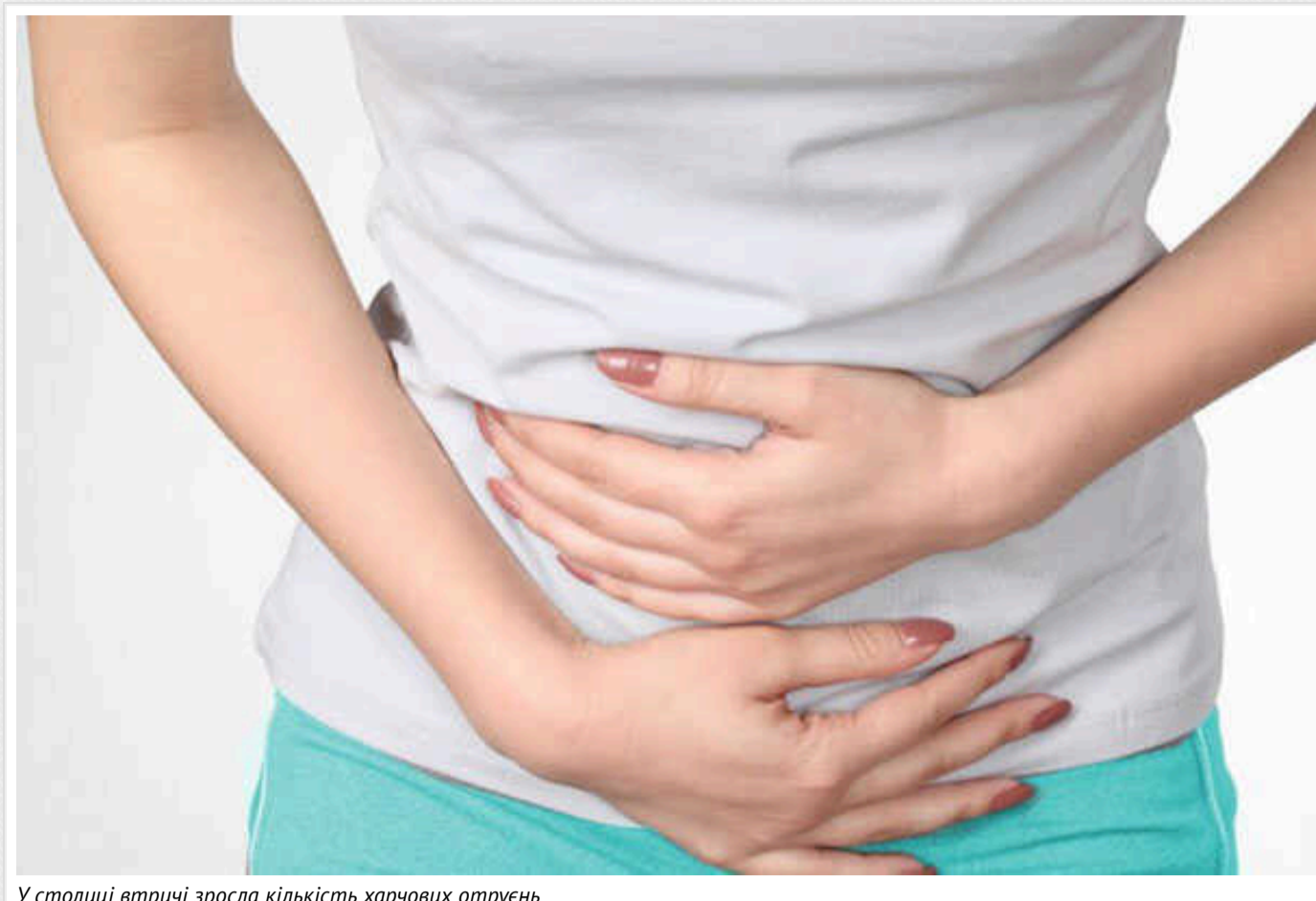
У столиці втреті зросла кількість харчових отруєнь

Столична Держспоживслужба заборонила роботу кейтерингової компанії, яка забезпечувала харчуванням понад пів сотні приватних освітніх установ через невідповідні умови зберігання продуктів у спеку.