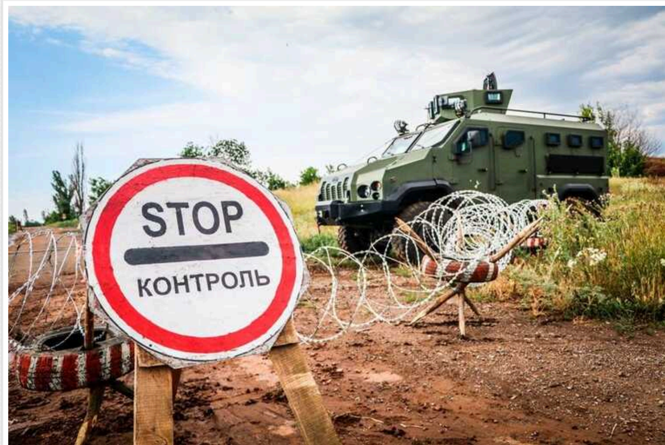
ЗМІ опублікували перелік прав українців, які не може обмежувати воєнний стан

В Україні з початку повномасштабного російського вторгнення діє правовий режим воєнного стану. Цей режим дозволяє обмежувати права громадян, але не всі.