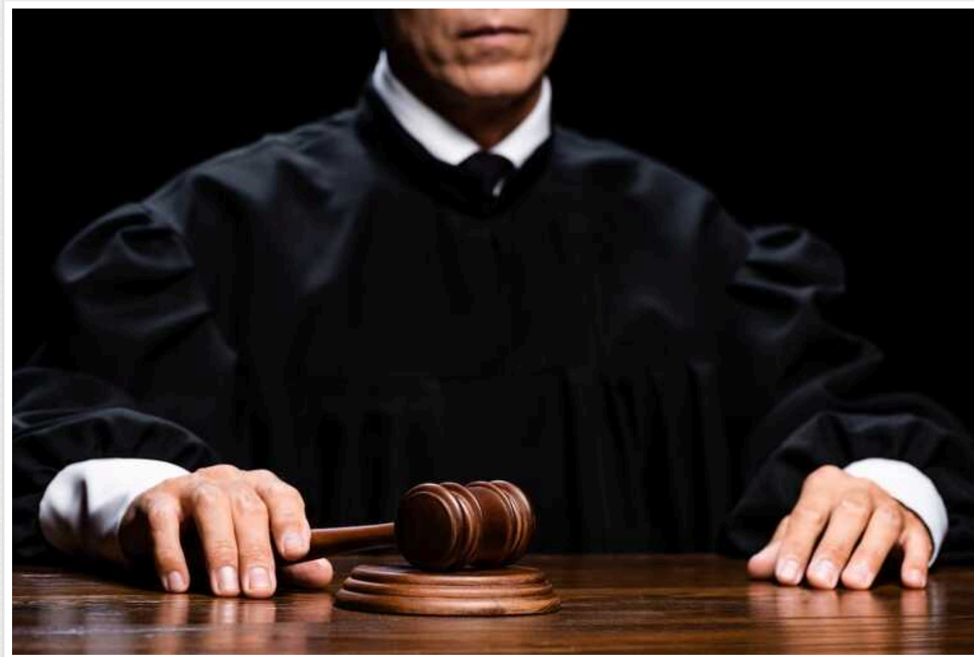
Суддя Господарського суду Дніпропетровщини отримав підозру за організацію викрадення

Судді Господарського суду Дніпропетровщини, який замовив викрадення свого бізнес-партнера, оголосили підозру за фактом замаху на викрадення людини та організації незаконного позбавлення волі (ч. 2 ст. 15 ч. 3 ст. 27 ч. 2 ст. 146 КК).