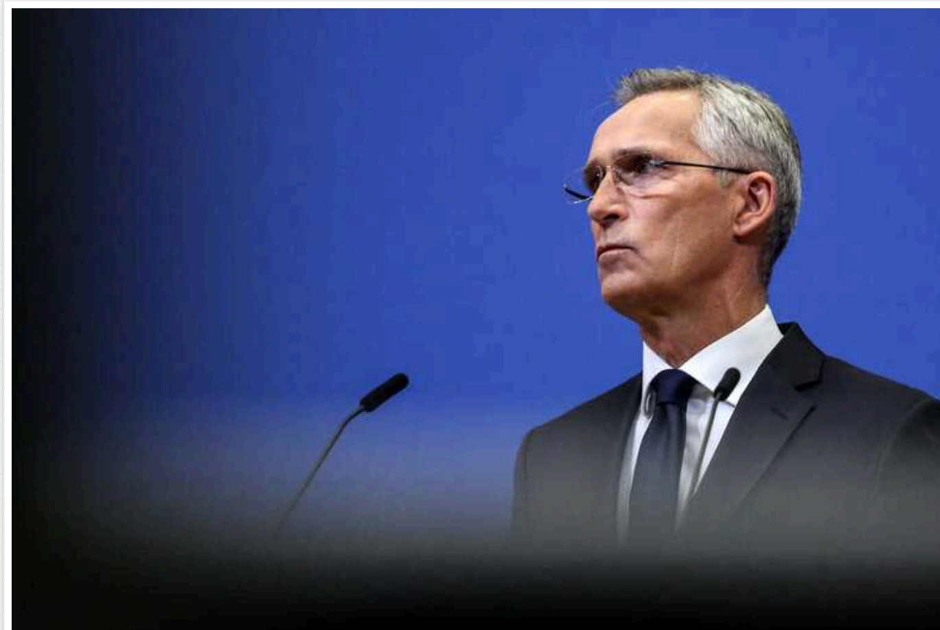
У РНБО відреагували на коментар Столтенберга проти збиття Польщею ракет над Україною

НАТО не змінило своєї позиції та не буде безпосередньо залучене у війну РФ проти України.