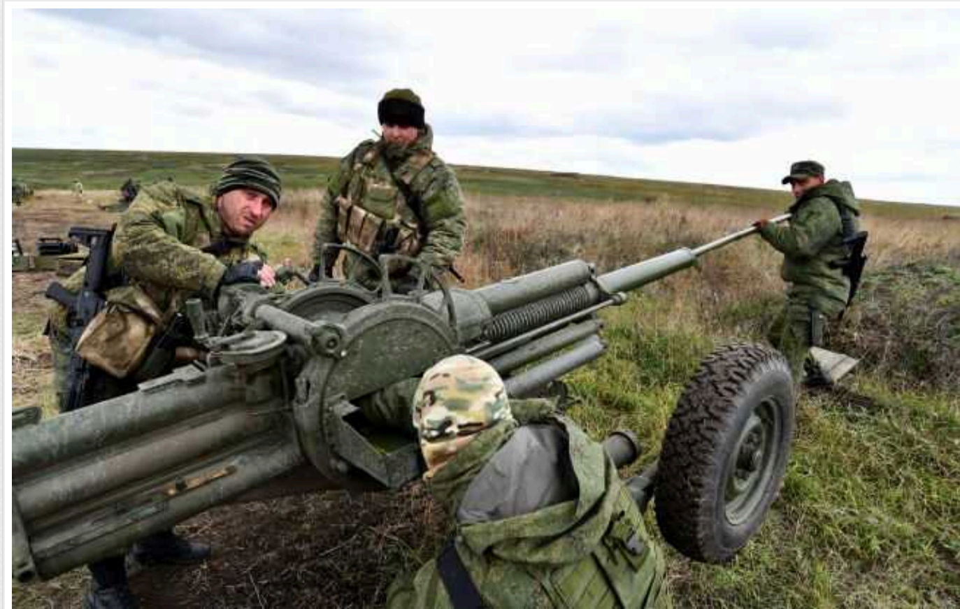
Ситуація на фронті: загарбники активно штурмують на Покровському та Торецькому напрямках

У неділю, 14 липня, станом на 16:00 на фронті найгарячішою ситуація залишається на Покровському напрямку. Також ворог активно штурмує на Торецькому напрямку.