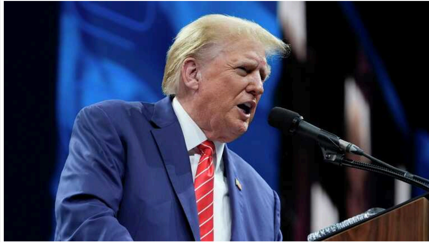
Ми не будемо боятися і залишатимемося непохитними перед обличчям зла, - Трамп

Кандидат у президенти США Дональд Трамп після замаху на нього в Пенсільванії звернувся до американців. Він подякував за підтримку і закликав не боятися та залишатися "непохитними перед обличчям зла".