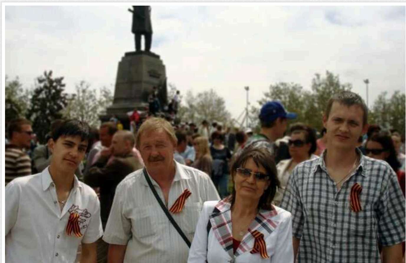
ЗМІ ідентифікували 12 зрадників України, які навчають мобілізованих росіян вбивати

Українські журналісти-розслідувачі ідентифікували 151 "воєнного спеціаліста", на яких держава-терорист Росія поклала місію навчати тисячі мобілізованих росіян. 12 "фахівців" із цього переліку мають громадянство України, але зрадили свою державу і не просто навчають, але й беруть участь у війні на боці ворога.