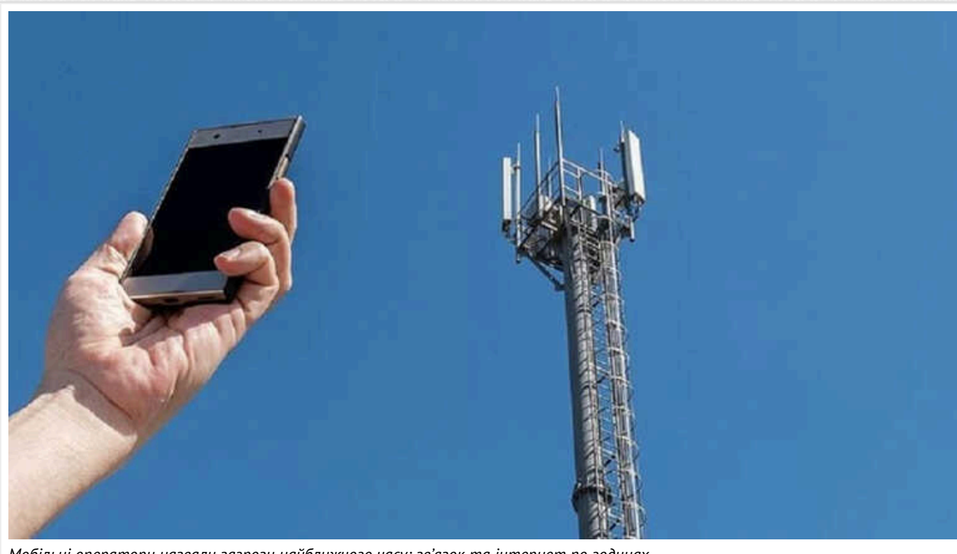
Мобільні оператори назвали загрози найближчого часу: зв'язок та інтернет по годинах

В Україні можуть з'явитись нові складнощі з мобільним зв'язком і мобільним інтернетом, якість яких напряму залежить від електроживлення відповідного обладнання. Внаслідок обстрілів енергетичної інфраструктури та відключення світла абоненти всіх операторів скаржаться на погіршення якості зв'язку та інтернету.