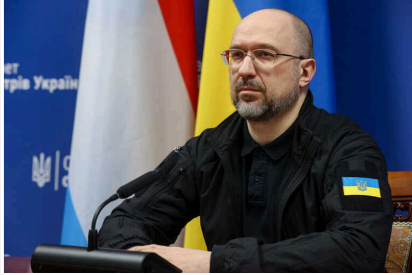
Шмигаль: Ситуація в енергетиці має покращитися з 20-х чисел липня

В Україні ситуація у сфері енергетики має покращитися з 20 чисел липня цього року.