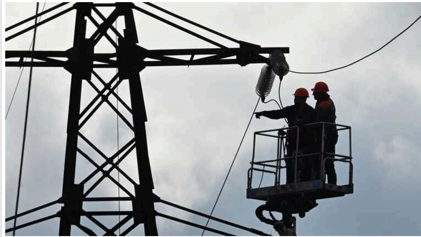
У соцмережах шириться російська ІПСО з підбуренням українців до агресії через відключення світла

Росіяни поширюють у соціальних мережах заклики до агресії через графіки відключень світла.