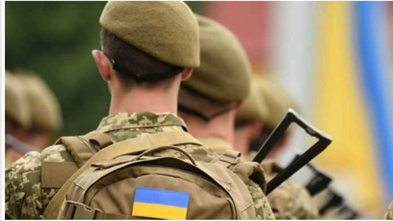
Повістку про виклик надсилатимуть не пізніше ніж через 48 годин після підпису керівником ТЦК, - Кабмін

Уряд оприлюднив зміни до Порядку проведення призову громадян на військову службу під час мобілізації.