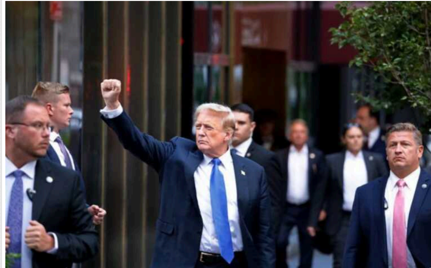
Meta зняла обмеження щодо акаунтів Трампа у Facebook та Instagram

Облікові записи Дональда Трампа у соціальних мережах Facebook та Instagram відтепер обмежені лише стандартними правилами для користувачів. Компанія Meta скасувала додаткові "запобіжники", які застосовувалися до сторінок республіканця раніше.