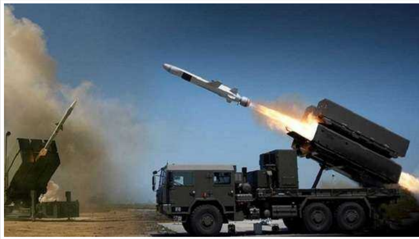
Forbes: Україна страждає від нестачі ракет для ППО

Їх може знадоблятися 2000 одиниць щорічно.